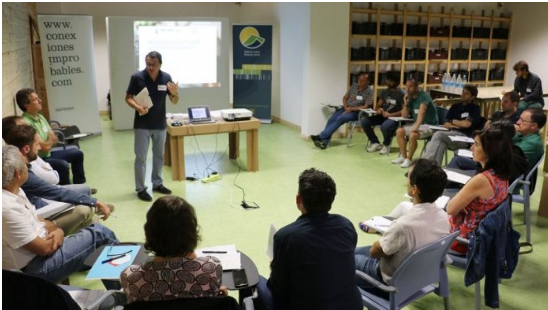
IrunLab Industria | IrunLab Industria