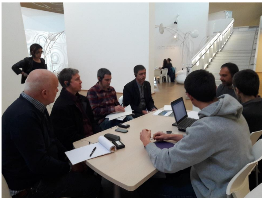
Taller « agitación portuaria – impactos sobre las infraestructuras de protección »