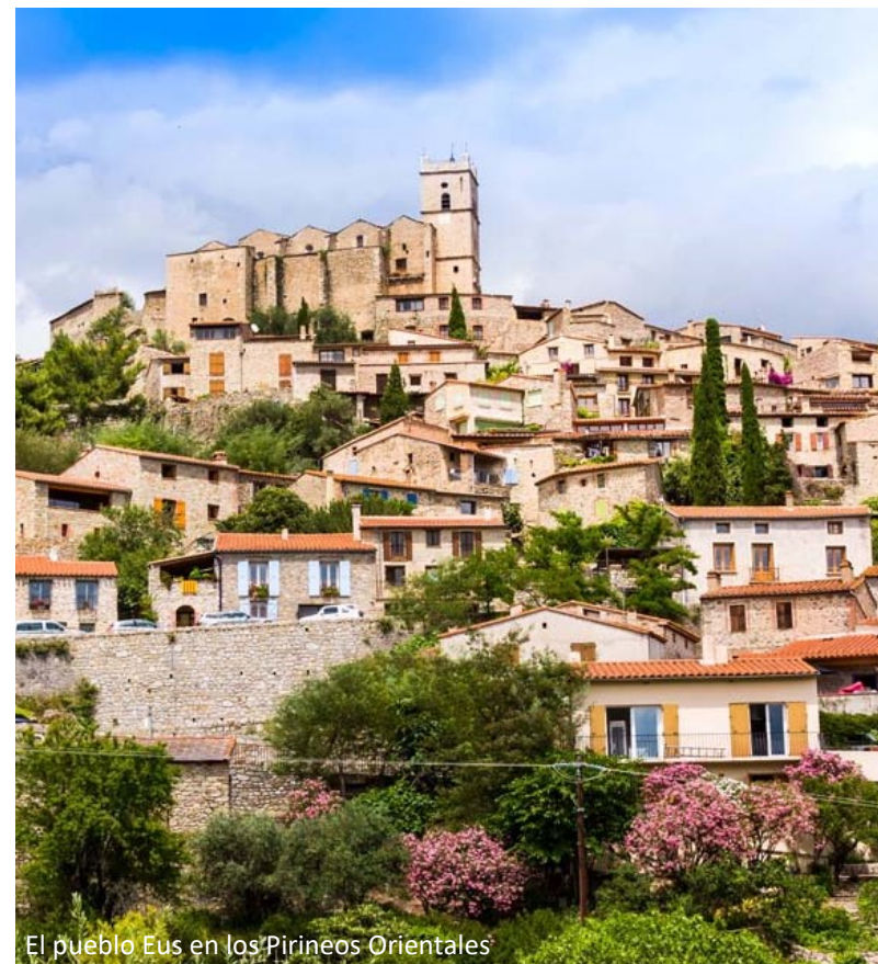
El pueblo Eus en los Pirineos Orientales

El destino debe fomentar campañas dirigidas a residentes y empresas locales sobre el uso del transporte público y la ecomovilidad.