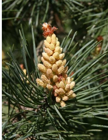
Mireille Mouas IDF © CNPF