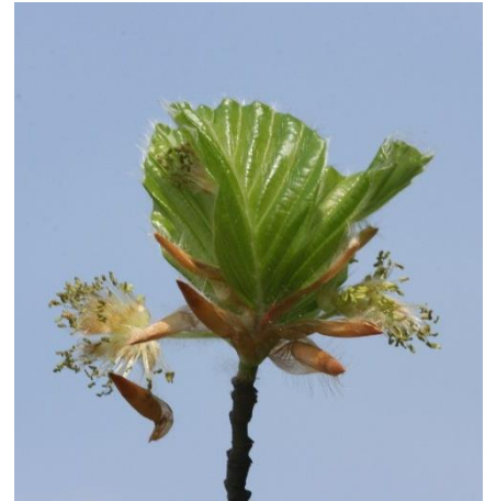
Mireille Mouas IDF © CNPF