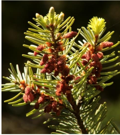
Mireille Mouas IDF © CNPF