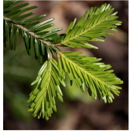
Sylvain Gaudin © CNPF