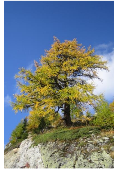
Mitad de la coloración de las hojas