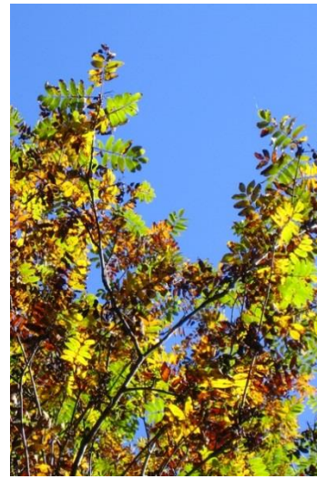
Mitad de la coloración de las hojas