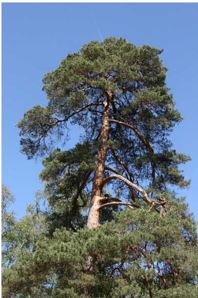
Mireille Mouas IDF © CNPF