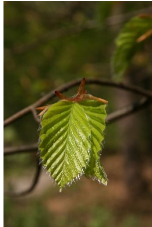
Mireille Mouas IDF © CNPF