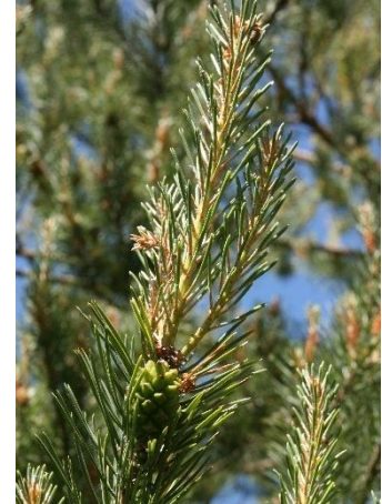
Mireille Mouas IDF © CNPF