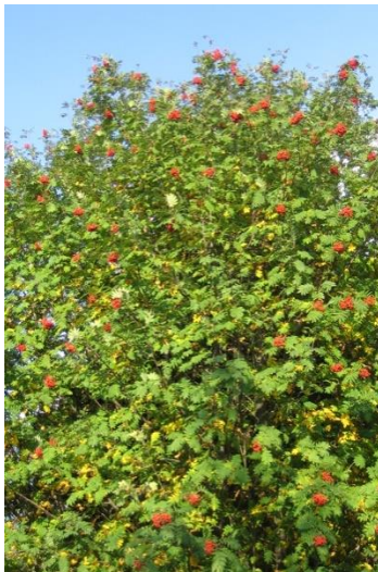
Inicio de la coloración de las hojas