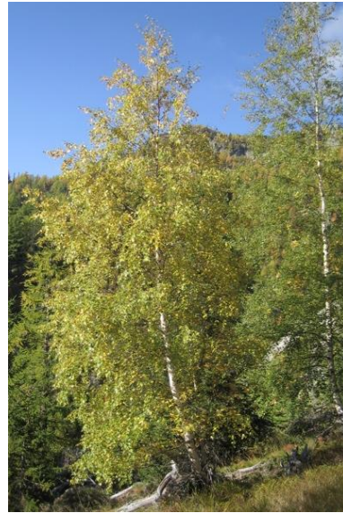
Mitad de la coloración de las hojas