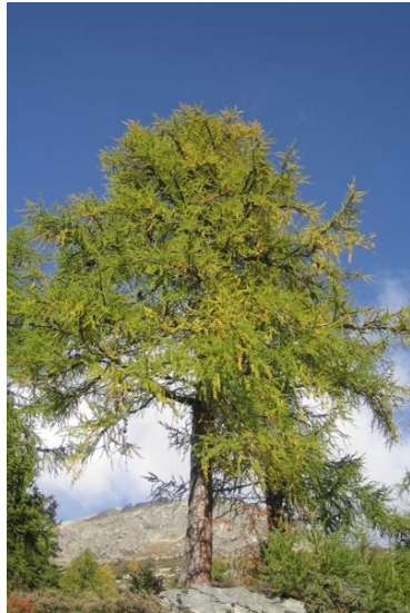
Inicio de la coloración de las hojas