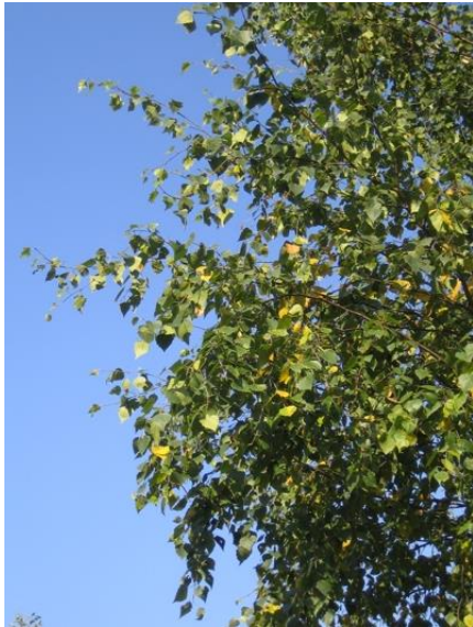
Inicio de la coloración de las hojas