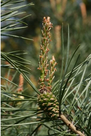
Mireille Mouas IDF © CNPF

En primavera, desde finales de abril, las nuevas acículas de color verde claro crecen al extremo de cada rama. La floración del pino albar se extiende de mayo a junio, hecho que permite a la especie resistir las heladas primaverales. Las piñas tardan un año en madurar.