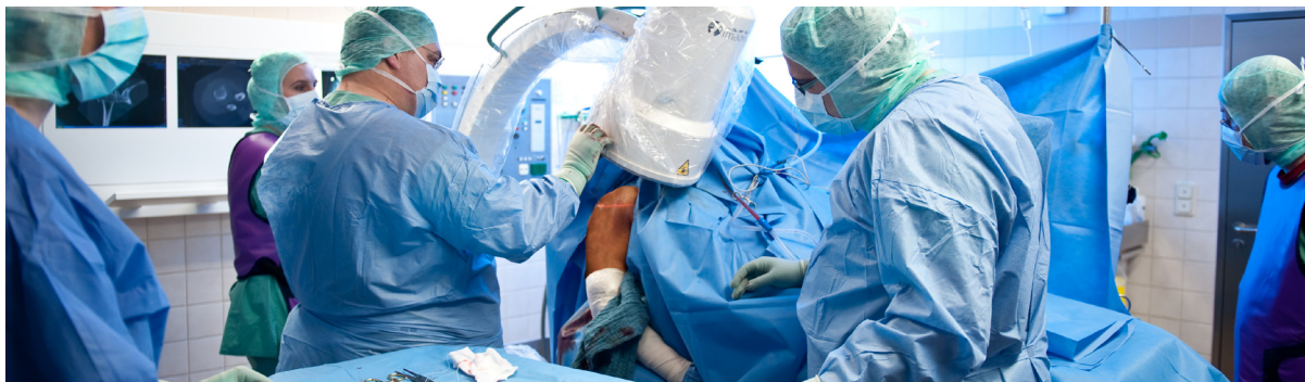
Das Knochenmark wird bei einer Routineoperation entnommen. Knoglemarven fjernes under en rutineoperation.

BONEBANK-partnerne har udviklet en proceskæde til transport for at levende stamceller forbliver intakt fra operationsrummet til opbevaring. Transport- og opbevaringsforholdene skal omhyggeligt koordineres for at sikre biomaterialets kvalitet.