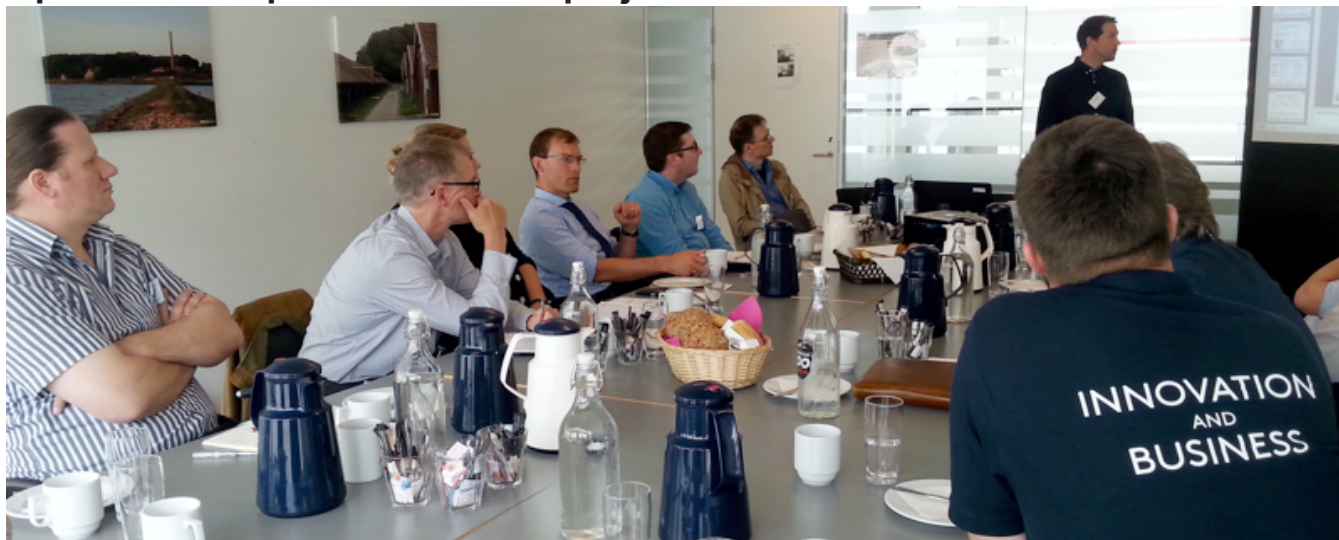
Den 25. maj 2016 blev der i Sønderborg afholdt opstartsmøde på et nyt Interreg5a projekt.