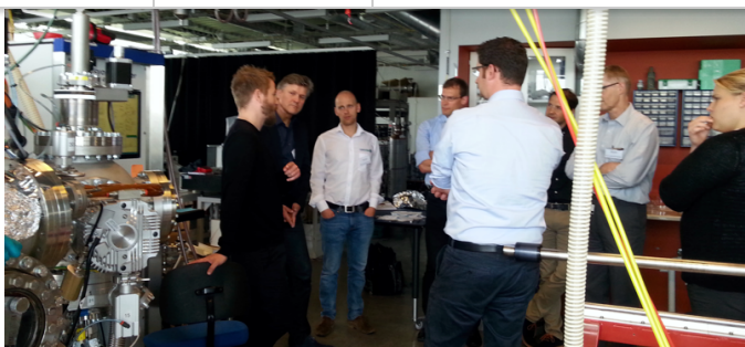
The image shows some of the participants visiting the Optics-Lab at the MCI.