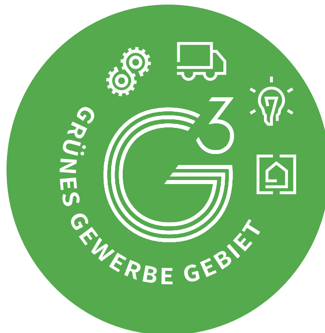
Das Label "Grünes Gewerbe Gebiet" mit Zusatzqualifikationen

„Grüne Gewerbegebiete in M-V“ sind Teil des Projekts „Baltic Energy Areas – A Planning Perspective“ (BEA-APP). Insgesamt elf Partner aus der Ostseeregion wollen in diesem Rahmen mit Mecklenburg-Vorpommern als federführendem Partner die Praxis in der Energie-, Regional- und Landesplanung verbessern.