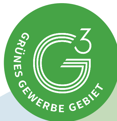
Das Label „Grünes Gewerbe Gebiet“

Gewerbegebiete können Zusatzqualifikationen erwerben, wenn sie sich durch besondere Nachhaltigkeit auszeichnen.