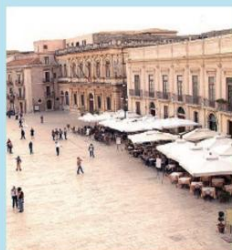
Piazza Duomo in Ortigia

Imprese sociali e Terzo settore pubblico e privato lavorano insieme