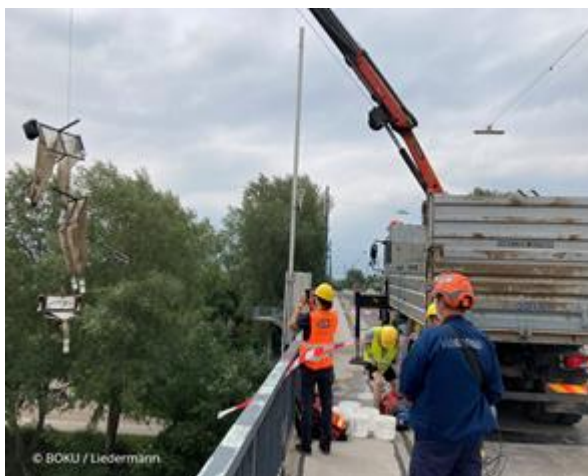
Messung des Kunststofftransports mittels Netzen an der Freudenauser Hafensbrücke

Kunststoffe können einerseits über Zubringer wie z.B. den Donaukanal in den Fluss eingetragen werden, andererseits z.B. auch in den Rechen der Kraftwerke hängenbleiben. Um diese Ein- und Austragspfade besser abschätzen zu können, wurden in der Donau