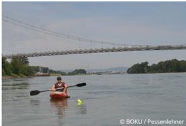
“Begleitung” der Tracer

Zur Verfolgung von einzelnen Plastikteilen wurden Tests mit GPS Tracern an der Donau durchgeführt. Dazu wurden unterschiedliche Makroplastikteile, die im Rahmen von Sammelaktionen häufig im Nationalpark Donauauen gefunden werden (PET Flaschen, PU Schaum, Schuhe, Tennisbälle etc.), farblich markiert und mit Sendern bestückt und in der