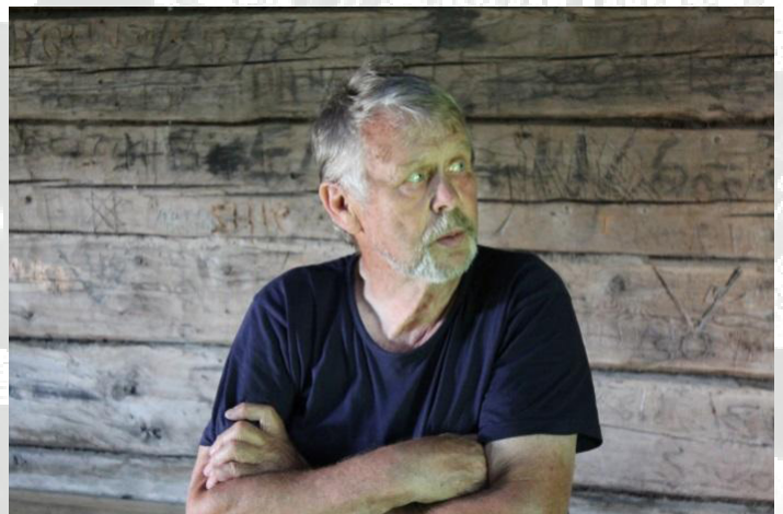
Kuva: Per Grape (Jarno Niskala.)