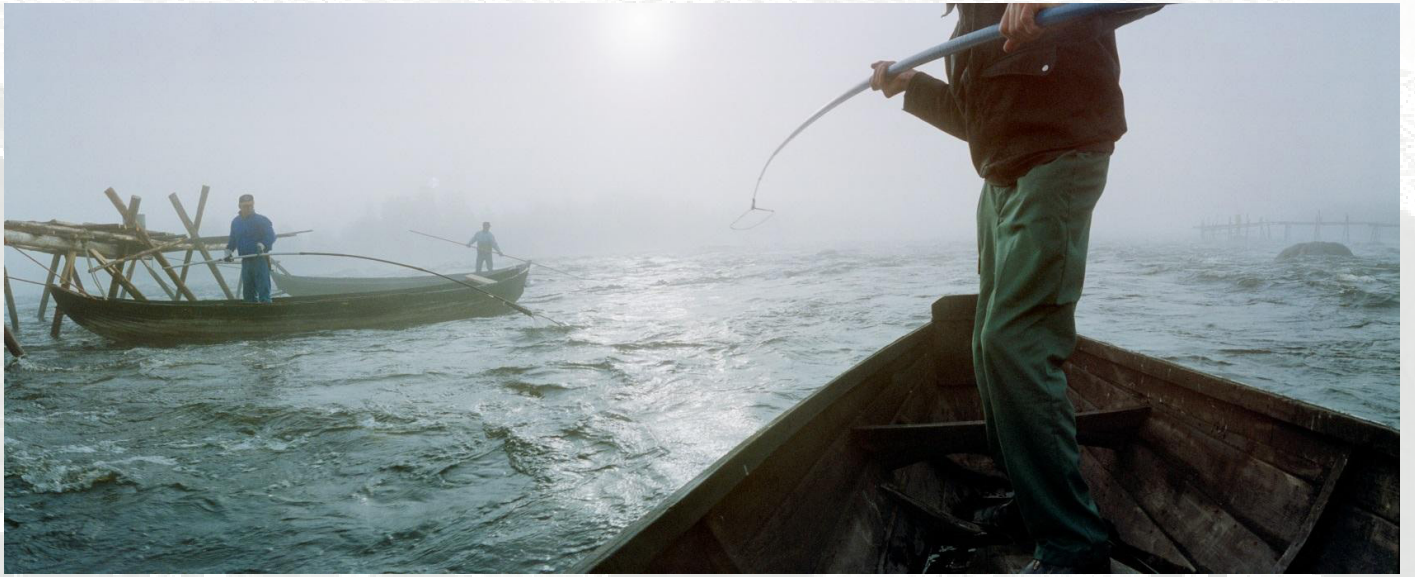
Kuva: Aamulippoajat. (Jaakko Heikkilä.)