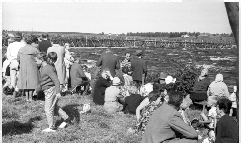
Kuva: Ihmisiä kerääntynyt koskelle 1952.