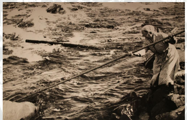
Kuva: Ida Juuso. Karl-Erik Kaupin kuva.