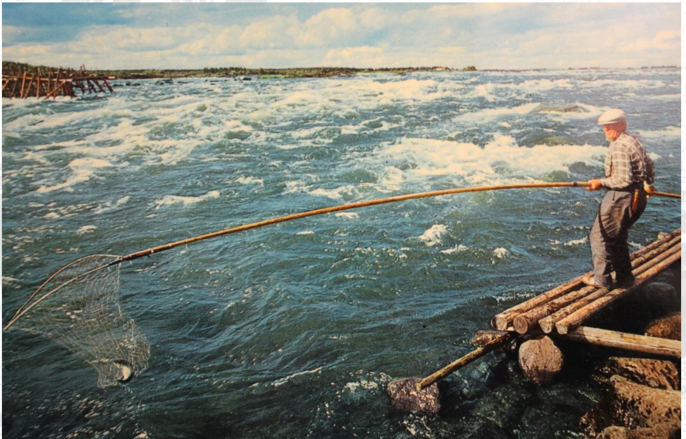
Kuva: Väinö Niskala lippoaa. (Suomen kalakirjasto.)