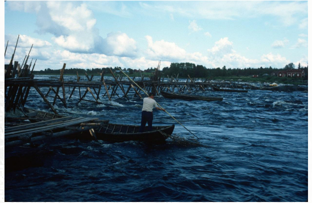
Kuva: Venelippouksia oli useita. (Suomen kalakirjasto 1984.)

ko sielä ei ole miestä, joka pystyy menheen karinhänthään. Näe se sieltä myllyn alta, elikkä sieltä Lahti Leon paon alta lähethiin soutuvenheelä ja panthiin se ylishen putthaan puttoukseen. Ja sitten Karin kosteus siihen ja sitten ankkuroithiin sinne. Sinne oli ennen ankkuroitu vene, soutuvenheelä ne kuljit sielä venheessä. Mie pruukasin jäähä siihen Ruohokalliolle ja siinä oli helkkarin hyvä onkia harria.”