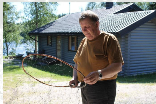
Kuva: Juha Nuoriaho (Jarno Niskala)