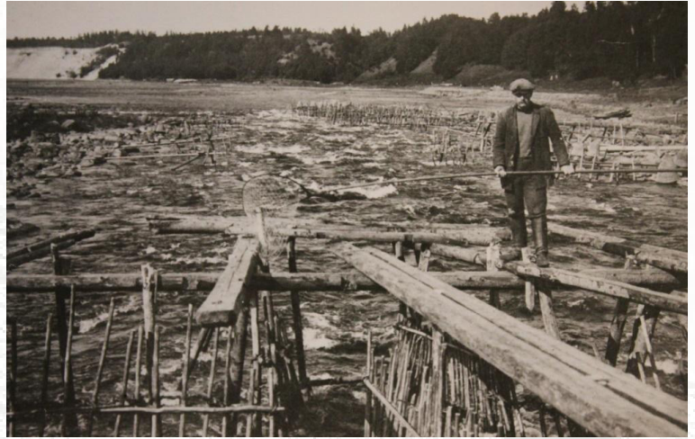
Kuva: Siian lippoaja Savikon tokeella 1914. Kokemäenjoki.