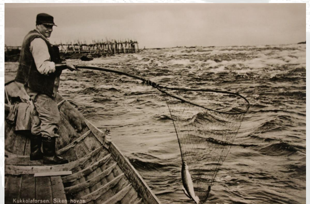
Kuva: Venelippous Kukkolankoskessa.

”Meiloli Niskalan Matti vainaan kans vene valkamaassa. Näe ko silloin ei laitettu renkuja, niin soli vene sitte, soli kylän vene, se laskettiin aina siittä rengaskivestä sinne alemmaksi.”