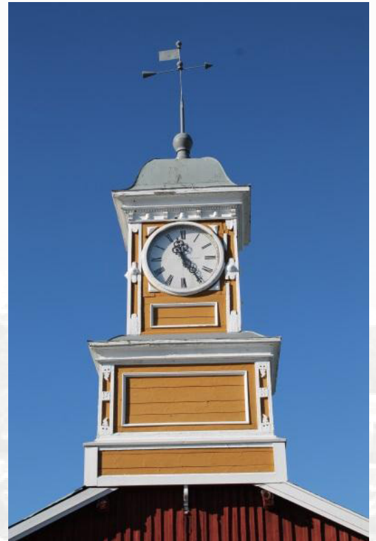
Kuva: Kukkolassa kellotorni näytti lippoajille paikallisen ajan.