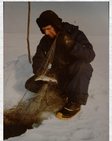
Talvipyyntiä 1983

Talvinuottaustakin oli ennen, pääasiassa pyydettiin maivaa. "Se on ollut vanha tapa. Silloin ko ei ollu moottorivinssejä niin hevonen pyöritti vinssiä." Verkkoa voitiin kuljettaa jään alla rimalla, saukolla tai jopa pienellä sukellusveneellä. Apajapaikat pitää olla sellaisia, missä on silä pohja. Alapaula kulkee pohjaa myöten. Sopivia paikkoja on Lehtikarin länsi-pohjois- ja itäpuolella.