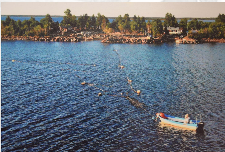
Ilmakuva rysästä

Lohenkalastuslisenssejä on kahdenlaisia, ykkösryhmää ja kakkosryhmää. Jotta pääsee ykkösryhmään, pitää olla kalastustuloja yli 10 000 euroa vuodessa. He saavat aloittaa pyynnin kaksi viikkoa aiemmin kuin kakkosryhmäläiset. Hylkeensietokorvauksia kakkosryhmäläiset eivät saa. Nykyisin ykkösryhmä aloittaa lohenpyynnin 17. kesäkuuta ja kakkosryhmä 2. heinäkuuta. Lohenkalastusta voi harjoittaa sinne heinäkuun lopulle, johon asti kalaa vielä on.