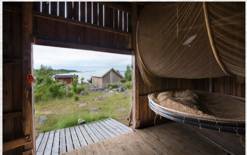
Pensaskarissa on kunnostettu rakennuksia ja tallennettu vanhaa kalastusesineistöä.