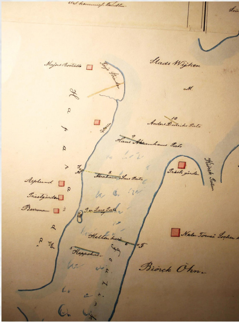
Patokalastuksia Alatornion kirkon kohdalla 1741 kartan (Hackzell) mukaan.