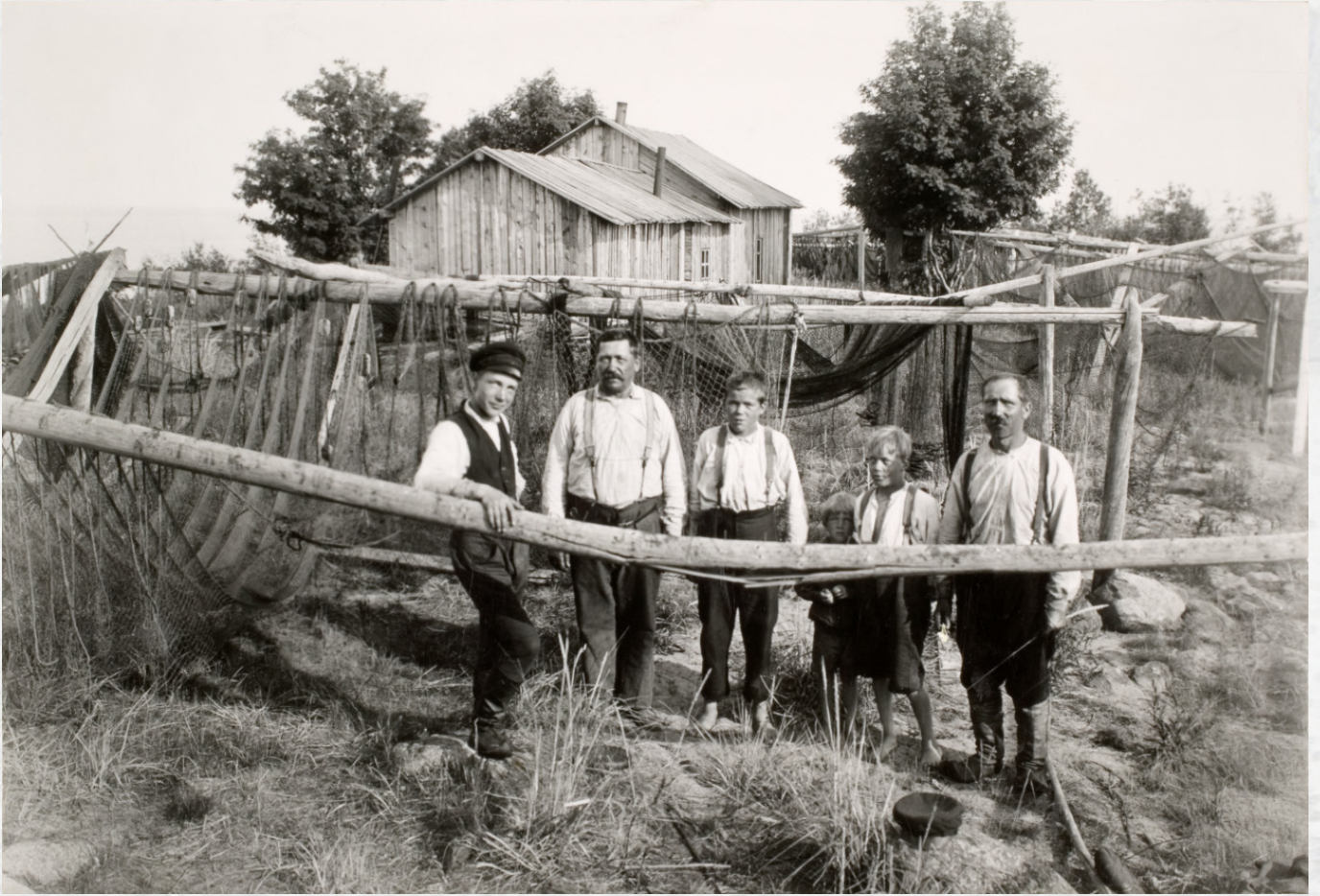
Väätäjän veljekset Kuivaniemestä Röytän Taljan kalastuspaikalla verkonkuivaustelineidensä äärellä. Kuvaaja T.H. Järvi 7.7.1925. (Kuva: Museoviraston kuvakokoelmat, Kansatieteen kuvakokoelma)