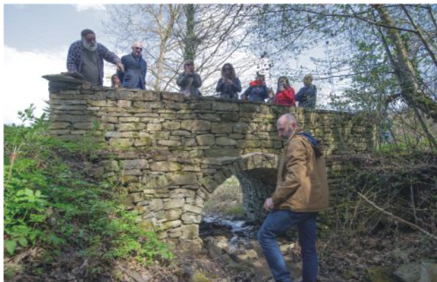
Foto 5. Účastníci projektu CRinMA počas študijnej cesty v regióne Alta Langa, kde sa dozvedeli, ako sa miestny kameň využíval od rímskych čias až po súčasnosť.

toky a útesy. V období neolitu, keď ľudia začali s kultiváciou pôdy, boli kamene považované len za prekážku pri poľnohospodárskych prácach. Neskôr sa ich však naučili používať na výstavbu terás. Kameň sa stal ľahko dostupnou surovinou používanou pri