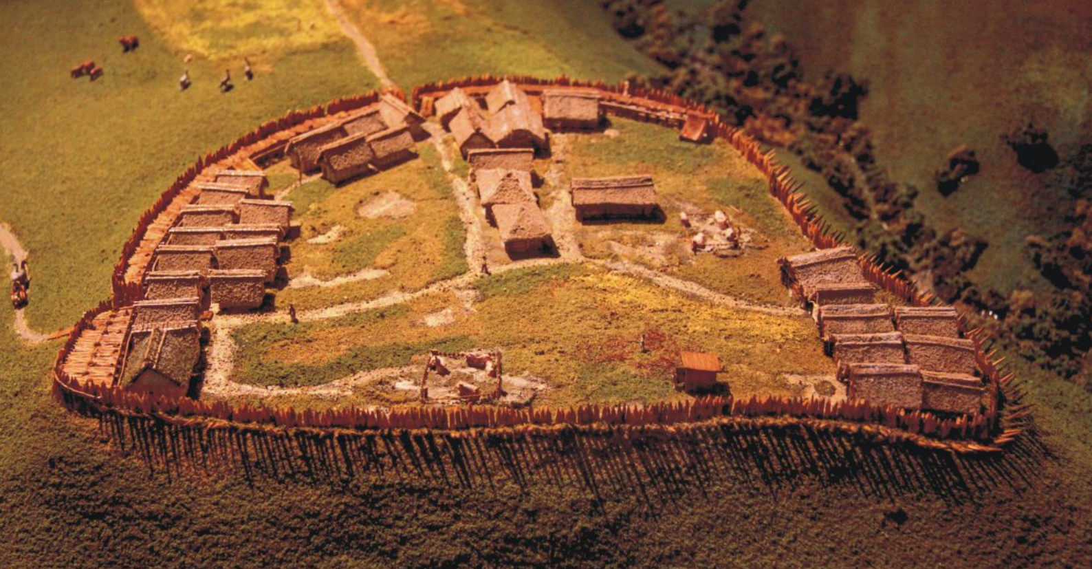
Foto 19. Karpatská Trója je jedinečnou kombináciou tradičnej formy skanzenu a moderného múzea. Ku komplexu múzea patria aj pozostatky pôvodnej architektúry hradiska a archeopark situovaný na úpätí kopca.

Podobnosť trzcinickej a skutočnej Tróje vychádza najmä z chronológie, nakoľko tunajšia opevnená osada bola založená približne v rovnakom období, ako Mykénčania postavili svoje legendárne sídlo v Grécku.