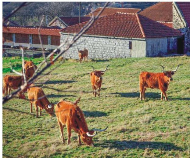
Foto 16. Počas turistiky v parku Peneda-Gerês môžete stretnúť aj vzácne druhy zvierat - typický dlhoročný dobytok Barrosão, ktorý sa chová len v tomto regióne.

Viac informácií o projekte: http://www.europeanheritageawards.eu/winners/sustainable-development-mourela-plateau-peneda-geres-national-park/