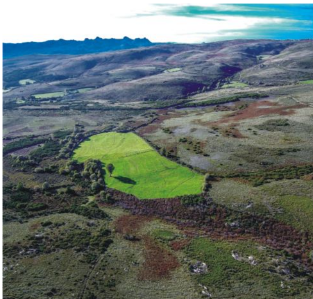
Foto 15. Pohorie Serra da Peneda-Gerêsleži v najsevernejšom cípe Portugalska. Jeho súčasťou je aj biosférická rezervácia UNESCO a Národný park Peneda-Gerês.

Zaujímavou iniciatívou v tejto oblasti je projekt prebiehajúci v chránenej oblasti Národného parku Peneda-Gerês, a konkrétne na nádhernej plošine Mourela pri meste Montalegre v severnom Portugalsku. Tunajšia krajina je výnimočná tým, že je priamo závislá na interakcii človeka s prírodou.