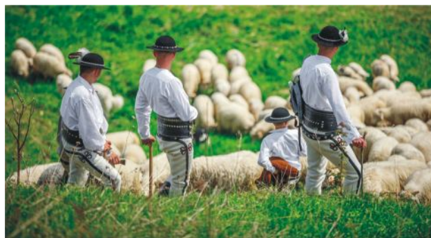
Foto 9. Rôznorodá vegetácia na podhalianskych lúkach má veľký vplyv na arómu mlieka pasúcich sa zvierat, a teda aj na kvalitu syra, ktorý sa z neho vyrába. Éterické oleje obsiahnuté v mnohých endemických druhoch rastlín prechádzajú do mlieka a dodávajú tak syru prirodzenú „korenistosť“.

Rozsiahle pasenie oviec na horských lúkach umožnilo rastlinám tvoriť nové kombinácie a vytvárať tak mozaiku druhov, ktoré sa týmto novým habitatom prispôbili. Horské lúky, ktoré sú poloprirodnými spoločenstvami rastlín, sú plné endemických rastlinných druhov (teda druhov, ktoré sa vyskytujú len na jedinom špecifickom území).