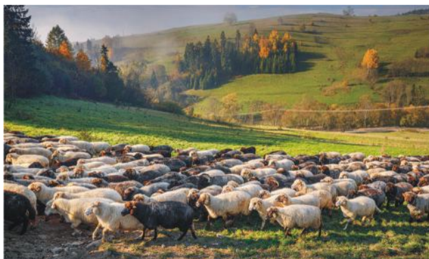
Foto 8. Pasenie dobytku na otvorených pastvinách Karpát je jedinečnou formou poľnohospodárskej aktivity nielen z hľadiska chovu zvierat, ale aj vzhľadom na ochranu tradičných metód a postupov.

Pastierstvo je súčasťou karpatských oblastí už celé stáročia. Vysokohorské pastviny, lesné poľany a salaše sú niečo, bez čoho si nedokážeme turistiku v Tatrách, Gorciach či v pohorí Beskid Sądecki ani predstaviť.