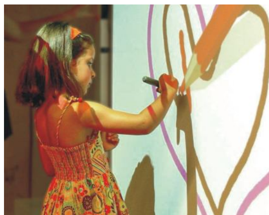
Foto 11 a 12. Digitálna transformácia kultúrneho dedičstva v podobe, ako ju realizuje Ekomúzeum Barroso, je dôkazom toho, ako radi využívame možnosti virtuálnej reality. Návšteva múzea sa stave interaktívnym zážitkom.