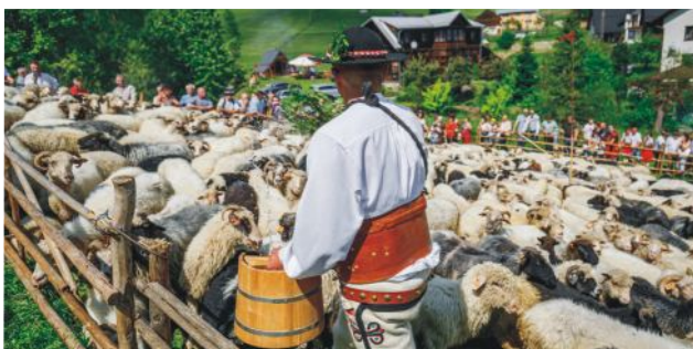
Foto 13. Vyháňanie dobytku a ďalšie pastierske podujatia organizované na Chodníku valaskej kultúry sú vyhľadávanými atrakciami a už si získali aj oddaných priaznivcov.

Ďalšie informácie sú dostupné na adrese: szlakwoloski.eu