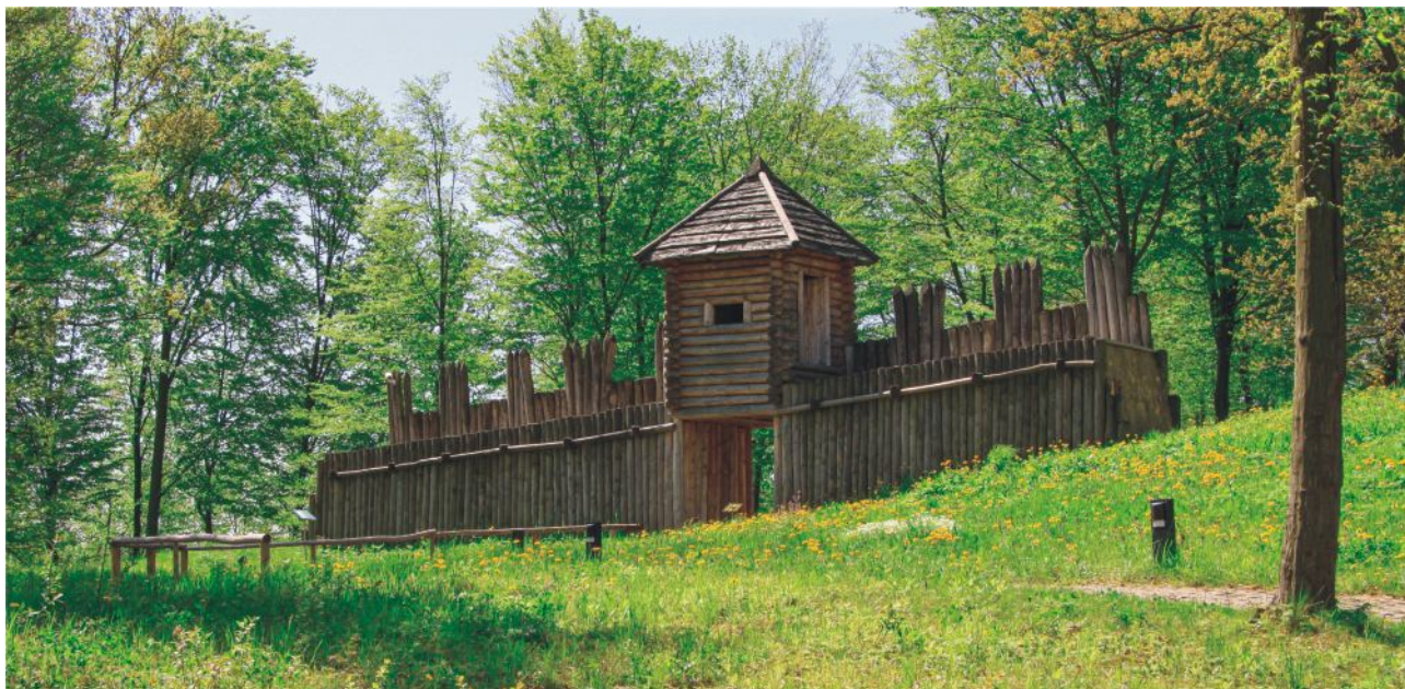
Foto 18. Skanzen a archeopark Karpatská Trója vznikol na mieste nálezů jedného z najstarších hradísk na území Poľska. Jeho vznik sa datuje do staršej doby bronzovej.

Lokalita známa ako „Karpatská Trója“ sa stala známou najmä po rozsiahlom archeologickom výskume, ktorý v Trzcinici prebiehal v 90. rokoch dvadsiateho storočia. Počas neho sa tu našlo viac než 160 000 historických artefaktov - starovekých remeselníckych a umeleckých predmetov. Nálezy tiež potvrdili, že osada v Trzcinici pochádza zo začiatku staršej doby bronzovej (2000 rokov p.n.l.), čo z nej robí jedno z najstarších opevnených sídel v Poľsku aj v tejto časti Európy.