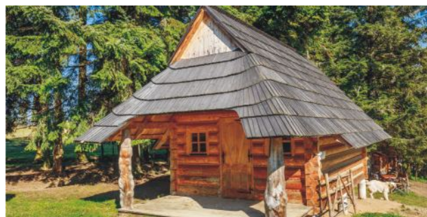
Foto 14. Salaš – vzdelávacie a informačné centrum v obci Łapsze Wyżne (Spiš, Poľsko) s expozíciou predmetov súvisiacich s pastierskymi tradíciami.