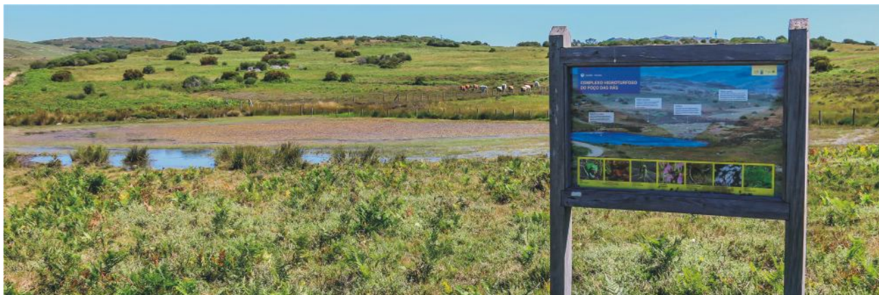
Foto 17. Park Peneda-Gerês vznikol pred štyridsiatimi rokmi kvôli ochrane endemických druhov rastlín a živočíchov na vzdelávacie a vedecké účely a na podporu cestovného ruchu. Chránené územia sú prístupné návštevníkom počas celého roka.