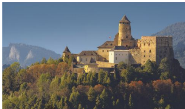
Foto 2. Stredoveký hrad (14. storočie) v Starej Ľubovni (Spiš, Slovensko) s krásnym výhľadom na Pieniny a pohorie Vysokých Tatier tiahnuce sa pozdĺž slovensko-poľskej hranice.

kreativity a duchovnosti ľudí žijúcich v horách bola všade rozhodujúca príroda a život v horách ako taký, so všetkými jeho aspektmi. Objavil som tiež veľa spoločných a vzájomne súvisiacich tém, či už z oblasti histórie, etnografie, ekonomiky, poľnohospodárstva, a pod..