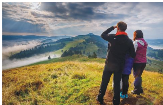
Foto 1. Horské oblasti sú hodnotnou súčasťou európskeho prírodného a kultúrneho dedičstva.

Všetky eseje a rozhovory publikované v tejto brožúre vyjadrujú subjektívne názory svojich autorov, účastníkov projektu CRinMA.