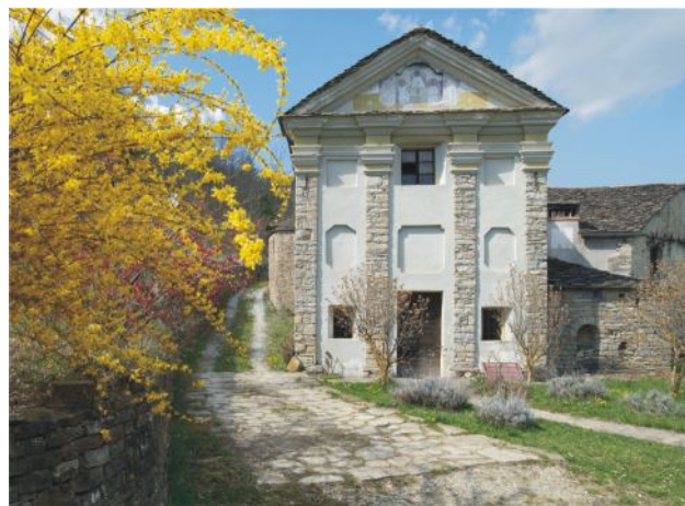
Foto 6 a 7. Kameň Langa sa po stáročia využíval ako univerzálny stavebný materiál na stavbu domov, hospodárskych budov a kostolov, ale aj na budovanie chodníkov a vytyčovanie terás a parciel, ktoré sa dodnes využívajú ako vinice sa ovocné sady.