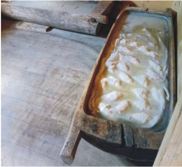
Foto 10. Výroba mliečnych výrobkov ako oštiepok, žinčica či bryndza patrí k tradíciám, ktoré sa na karpatských salašoch pestujú už viac než 400 rokov.

Tieto oblasti sú zároveň domovom živočíšnych druhov, ktoré tu našli vhodné zdroje potravy i prostredie na párenie. Vysoká miera biodiverzity je tak typickou črtou tunajších ekosystémov.