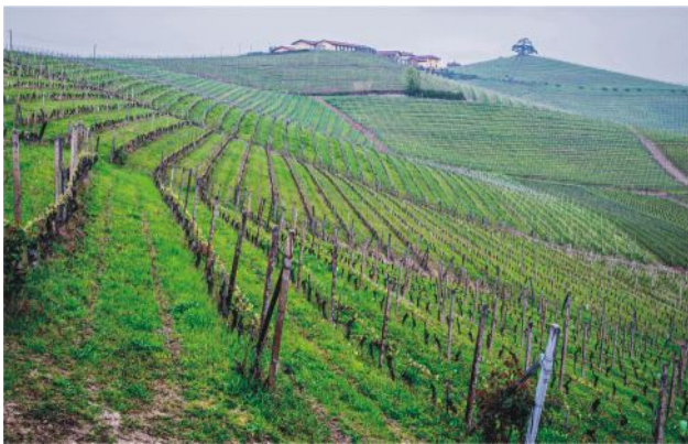
Foto 4. Unikátne kamenné terasy s vinicami na kopcoch Langhe, kde sa rodia niektoré z najlepších vín na svete (Alta Langa, Piemont).

Kameň Langa, alebo v taliančine Pietra di Langa, je pomenovaný podľa regiónu Alta Langa v južnom Piemonte, ktorý sa vyznačuje krásnymi terasovitými kopcami a je známy svojimi lieskovými orieškami. Geologická jedinečnosť tejto oblasti sa viaže k prítomnosti spomínaného exkluzívneho pieskovca. Ten je usadenou horninou tvorenou zrnkami piesku a slieňa a vznikol v období miocénu, pred 25 až 5,5 miliónmi rokov, keď bola táto oblasť pod hladinou zálivu zvaného Golfo Padano. V hĺbke 700-800 m pod povrchom sa nahromadili vrstvy piesku a naplavených hornín (slieňa) na miestach oplývajúcich bohatou morskou faunou, zastúpenou početnými