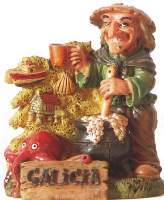
Foto 20. Galícijské bosorky „meigas“ neboli také zlé ako španielske „brujas“. „Meigas“ boli aj vedmami a liečiteľkami.

V oblasti Galície sú obľúbené staré keltské legendy, v ktorých „meigas“ hrajú hlavnú úlohu, najmä tie, kde bosorky uzavrú dohodu s diablom výmenou za svoje nadprirodzené schopnosti. Bosorky sa dokonca dostali aj do diel významných galícijských autoriek a autorov, ako je napr. Rozalia Castro.