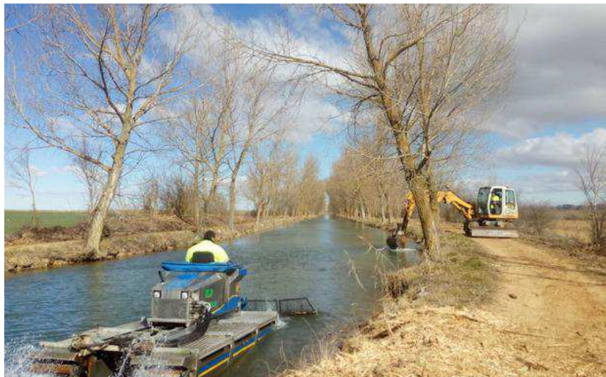
Tareas de limpieza y desbroce del Canal de Castilla en Medina de Rioseco, Valladolid.