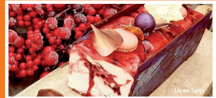
IJs en Spijs

Boerderijwinkel Cornelissen ist ein Bauernladen mit ausschließlich regionalen Produkten. Sie stellen hausgemachte Marmelade aus Früchten her, die im eigenen