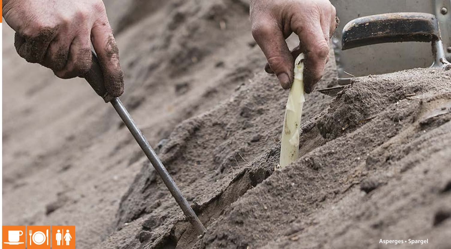
Asperges • Spargel

Ga op pad in het bourgondische Duitsland en ontdek wat de streek u te bieden heeft. Onderweg komt u langs het oude klooster Graefenthal , waar net als vroeger nog steeds eigen bier wordt gebrouwen. Waan u in middeleeuwse sferen en geniet van de huisgemaakte producten zoals kloosterbierkaas en dadeltaart.