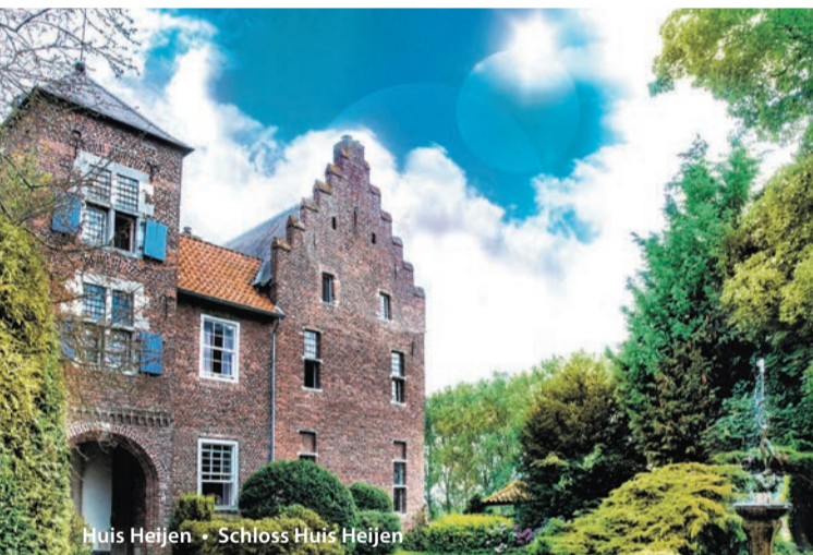
Huis Heijen • Schloss Huis Heijen

Aanvankelijk was Heijen een onderheerlijkheid van Gennep, pas in 1647 werd het een zelfstandige heerlijkheid. Ook de Heerlijkheid Boxmeer, het Graafschap Kleef en het Graafschap Gelre hadden zeggenschap over Heijen. Het huidige kasteel werd in het begin van de 16e eeuw gebouwd. Echter eind 16e eeuw, tijdens de Tachtigjarige Oorlog, grotendeels verwoest. Omstreeks 1600 werd het kasteel herbouwd. In 1944 werd Huis Heijen door Britse bommenwerpers zwaar beschadigd. Het huis is in particulier bezit. Het kasteel is te zien vanaf de weg. U kunt even afstappen om de laan in te lopen; het terrein is toegankelijk.