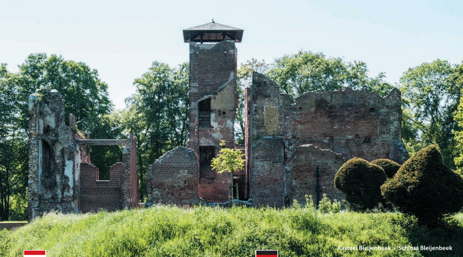
Kasteel Bleijenbeek • Schloss Bleijenbeek

Deze route is mede mogelijk gemaakt door: - Deze route wordt vriendelijk ondersteund van: