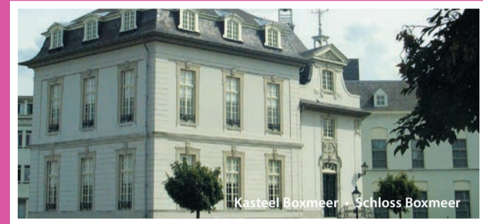
Kasteel Boxmeer • Schloss Boxmeer

Bis etwa zur Mitte des 16. Jahrhunderts war die Herrschaft Afferden auf zwei Landesherrn verteilt. Einer der beiden wohnte im Schloss im Deichvorland der Maas und hatte von der Burg aus (ungefähr dort, wo sich die heutige Fähre befindet) eine gute Aussicht auf die Maas. Am Ende des 16. Jahrhunderts wurde die Burg völlig zerstört. Der andere Landesherr wohnte in dem wichtigsten Schloss: Bleijenbeek, dass frei