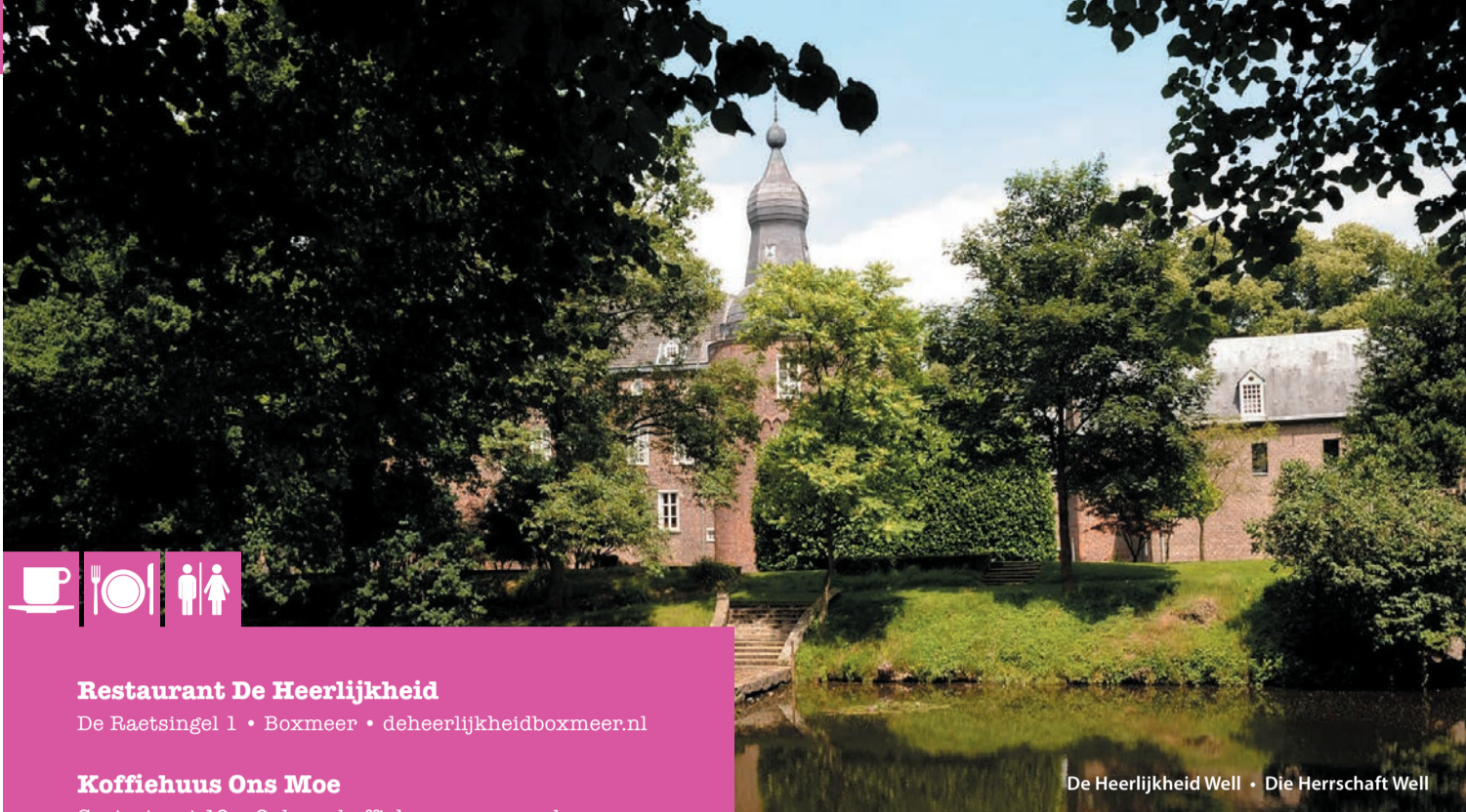
De Heerlijkheid Well • Die Herrschaft Well

Het klooster was 125 jaar lang (van 1252 tot 1376) de begraafplaats voor de dynastie van de familie Van Gelre en vormt daarmee de bakermat van de Gelderlandse geschiedenis. In 1808 werd de kerk afgebroken. Op het landgoed zijn, behalve het hooggraf van de stichter van het klooster, ook de prachtige en waardevolle gebouwen op het kloosterterrein, zoals het hoofgebouw (voormalig nonnenhuis), de remise, de duiventoren en de poortwoning te bewonderen.