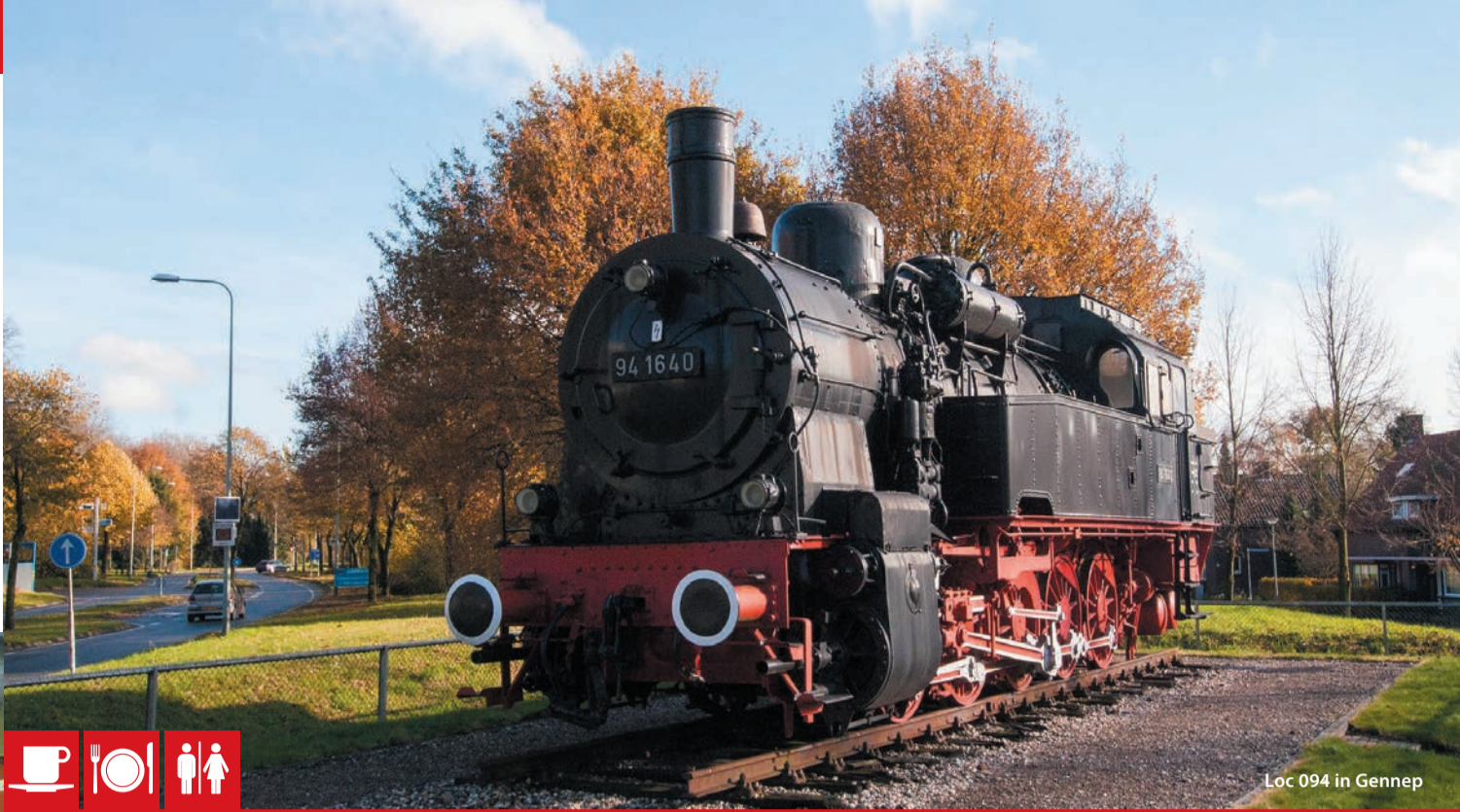
Loc 094 in Gennepe