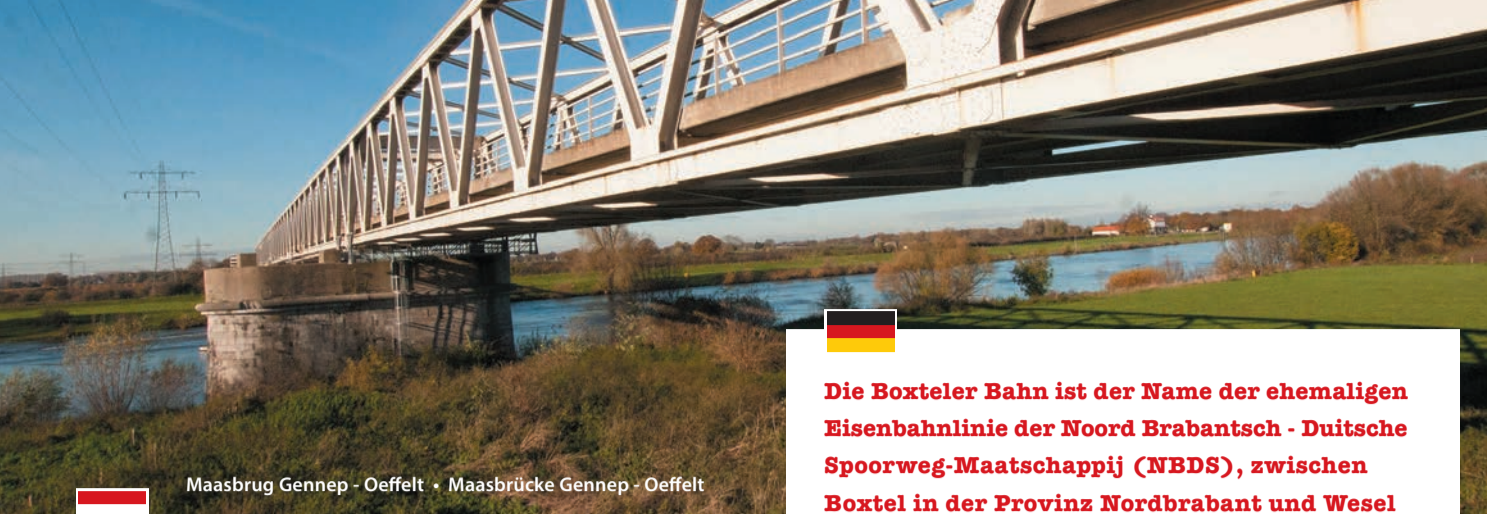
Maasbrug Gennep - Oeffelt • Maasbrücke Gennep - Oeffelt

Het Duits Lijntje, dat is de naam van de voormalige spoorlijn van de Noord Brabantsch - Duitse Spoorweg-Maatschappij (NBDS) tussen Boxtel in Brabant en Wesel in Duitsland. En, niet zomaar een spoorlijn: deze lijn was onderdeel van de unieke oost-westverbinding tussen Londen, Berlijn en Sint Petersburg. Tussen 1873 en 2004 werden zowel passagiers als goederen over deze lijn vervoerd.