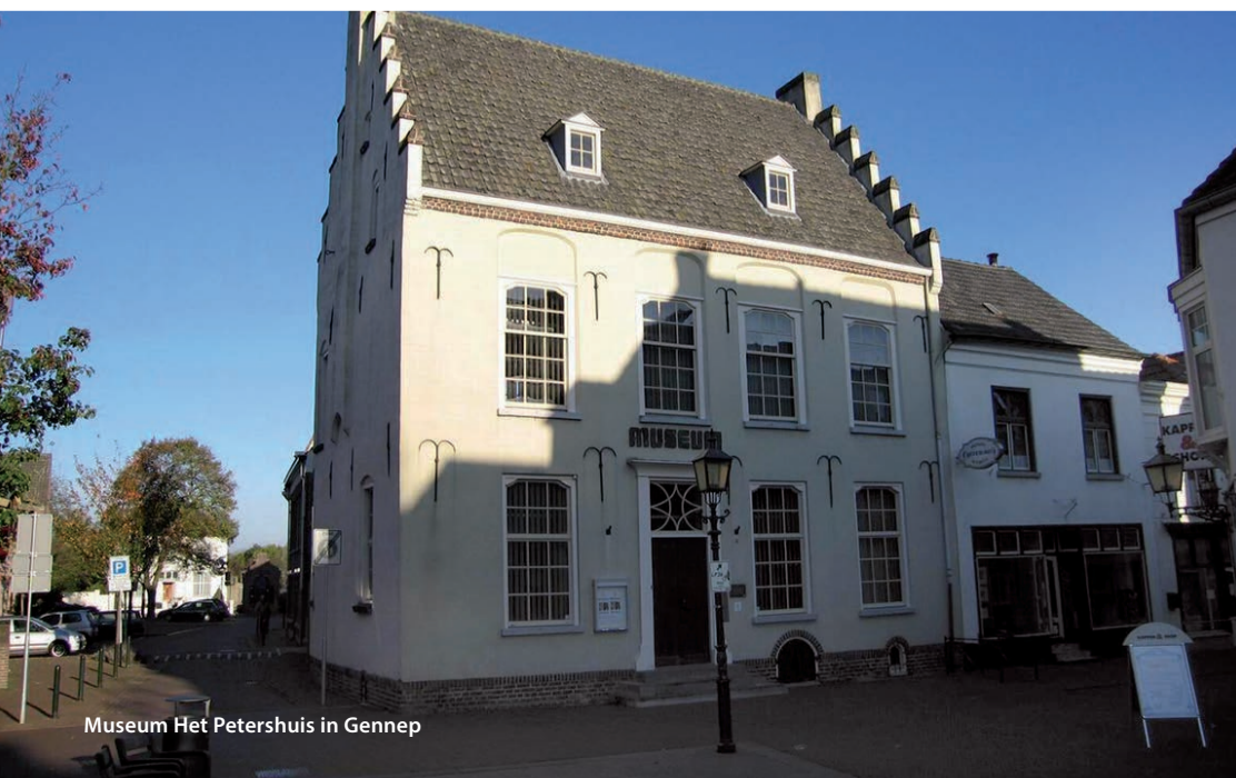
Museum Het Petershuis in Gennepe