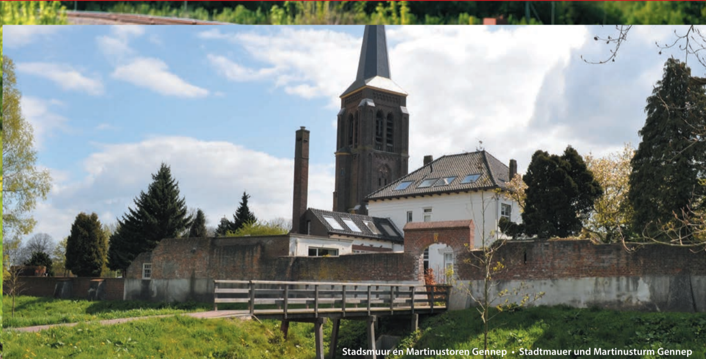
Stadsmuur en Martinustoren Gennep • Stadtmauer und Martinusturm Gennep

Als onderdeel van het Europese project 'Dynamic Borders' zijn tien thematische grensoverschrijdende fiets- en wandelroutes ontwikkeld. In Dynamic Borders werken onder meer de gemeenten Goch, Weeze, Gennep, Bergen, Bokmeer en Cuijk samen. Als Teil des europäischen Projekts 'Dynamic Borders' wurden zehn thematische Wanderrouten entwickelt. In diesem INTERREG-Projekt arbeiten unter anderem die Gemeinden Goch, Weeze, Gennep, Bergen, Bokmeer und Cuijk zusammen. Deze route is mede mogelijk gemaakt door: - Deze route wordt vriendelijk ondersteund van: -