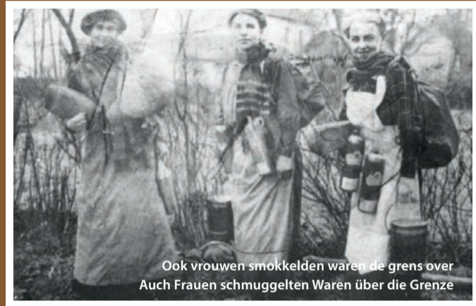
Ook vrouwen smokkelden waren de grens over Auch Frauen schmuggelten Waren über die Grenze

Grenzen kennen wir in vielerlei Arten: als natürliche Grenzen, kulturelle Grenzen, aber auch als