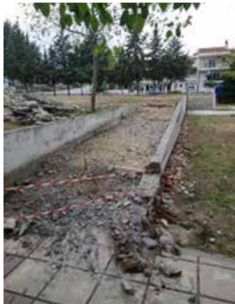
Ξεκίνησαν οι εργασίες για την κατασκευή του πάρκου ευαισθητοποίησης για τη φυτοποικιλότητα στην Κοινότητα Καρδίας.

Αναλυτικά οι εργασίες μεταξύ άλλων περιλαμβάνουν την οριοθέτησή του και την τοποθέτηση ξύλινης περίφραξης, θα διαθέτει δύο εισόδους που θα κλείνουν με ξύλινη πόρτα. Εσωτερικά θα διαμορφωθεί ένας διάδρομος που θα ενώνει τις δύο εισόδους ενώ προβλέπεται και η δημιουργία καθιστικού χώρου με παγκάκια και κιόσκι καθώς και περιοχή επιδαπέδιου παιχνιδιού (π.χ. κουτσό, τρίλιζα). Ο χώρος αυτός θα γειτνιάζει με την προβλεπόμενη περιοχή παιχνιδιών παιδικής χαράς, η οποία θα είναι σύγχρονων προδιαγραφών, θα διαθέτει ελαστικό τάπητα ασφαλείας και τρία νέα παιχνίδια.