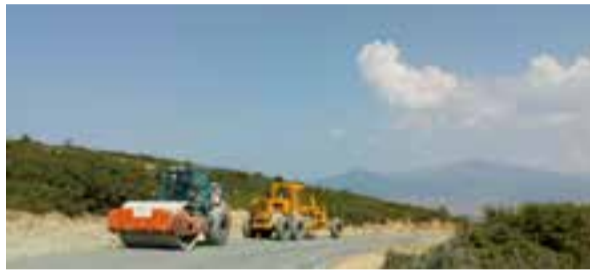
Από τα έργα ασφαλτοστρώσεως στα Βασιλικά.

Η αγροτική οδός Βασιλικών-Μονοπήγαδου ήταν διαμορφωμένη και χαλικοστρωμένη. Ωστόσο υπήρχαν σημαντικά προβλήματα στην επιφάνειά της, λόγω της απουσίας ασφατικής στρώσης και λόγω των μεγάλων κλίσεων, που επέτρεπαν στα όμβρια ύδατα να δημιουργούν αυλακώσεις. Στο πλαίσιο του έργου έγιναν εργασίες καθαρισμού τάφρων και διαμόρφωσης των πρηνών, επένδυση των τριγωνικών τάφρων με οπλισμένο σκυρόδεμα, κατασκευή υπόβασης οδοστρωσίας, όπου ήταν απαραίτητο για να ισοπεδωθεί ο δρόμος, και διάστρωση ασφατικής στρώσης. Επιπλέον, για λόγους ασφαλείας τοποθετήθηκαν σε κατάλληλες θέσεις μεταλλικά στηθαία ασφαλείας, επί μήκους περίπου 1.000 μ., πινακίδες σήμανσης και διαγράμμιση του οδοστρώματος.