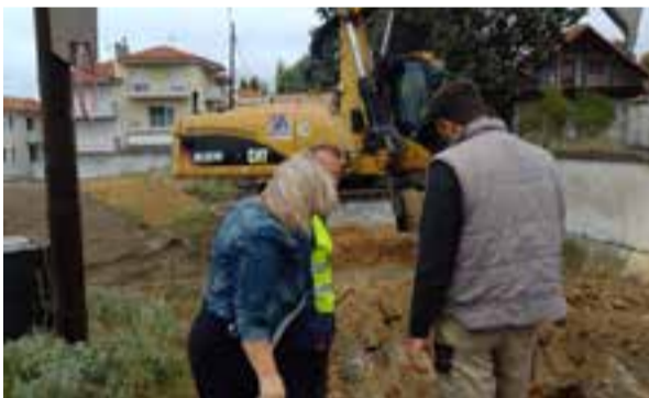
Σε εξέλιξη οι εργασίες για την κατασκευή του αποχετευτικού δικτύου της Αγίας Παρασκευής.