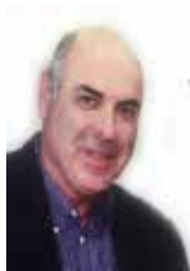
Ο αντιπρόεδρος Νίκος Λαγός.

βραδινή συνεδρίαση του Δημοτικού Συμβουλίου έχει ως εξής: