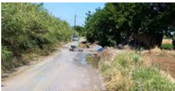
Ζημιές σε πολλά σημεία της αγροτικής οδοποιίας εξ αιτίας των ισχυρών βροχοπτώσεων σημειώθηκαν σε Τρίλοφο και Πλαγιάρι.

κτυο να είναι ιδιαίτερα προσεκτικοί καθώς χώματα, λάσπες και διαβρώσεις που έχουν σημειωθεί αποτελούν κίνδυνο για τα διερχόμενα οχήματα. Συνιστάται δε, να αποφεύγεται η διέλευση των οχημάτων από ρέματα και άλλα σημεία όπου συγκεντρώνονται μεγάλες ποσότητες