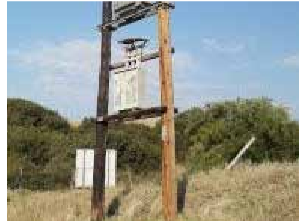
Μεγάλα προβλήματα δημιουργούν οι κλοπές μετασχηματιστών.

«Ο δήμος Θέρμης συγκάλεσε τη σύσκεψη όχι μόνο για να αναδειχτεί το πρόβλημα, αλλά για να ξεκινήσει μία συνεργασία και να υπάρξουν δεσμεύσεις από τους εμπλεκόμενους φορείς ώστε να βρεθεί λύση», είχε επι-