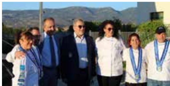
Ο υφυπουργός Εσωτερικών (Μακεδονίας Θράκης) Θεόδωρος Καραόγλου με το δήμαρχο Θέρμης Θεόδωρο Παπαδόπουλο κατά την τελετή εγκαινίων του φεστιβάλ.

Στο σύντομο χαιρετισμό του, ανοίγοντας τις εργασίες του φεστιβάλ, ο δήμαρχος Θέρμης Θεόδωρος Παπαδόπουλος, αφού καλωσόρισε τον υφυπουργό Εσωτερικών