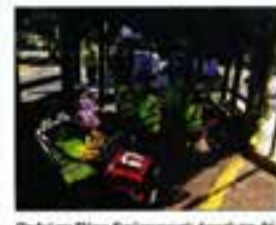
Παιδιά στο Πάρκο Κυκλοφοριακής Αγωγής της Θέρμης

Στα πλαίσια της λειτουργίας και παρέχεται είναι η γνησίως οι μαθητές τους κανόνες οδικής ασφάλειας και να συμμετέχουν σε εκπαιδευτικές δραστηριότητες, μέσα από τις οποίες ενισχυθεί η αυτογνωσία και θα αναλυθούν οι διαδικασίες της κυκλοφοριακής αγωγής.