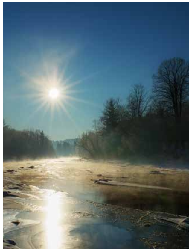
fol. Kamil Milewski

Średni przepływ wody wynosi: w Przemyślu 50,8 m 3 /s, w Radomyślu 126 m 3 /s, natomiast maksymalna rozpiętość wahań stanów wody oscyluje w granicach od 8,6 m w Przemyślu do około 7 m w Radomyślu. San odprowadza do Wisły prawie 4 mln m 3 wody rocznie. Średnia wyrównana temperatura wody wynosi w zimie 3,0°C, w lecie 15,8°C. San jest żeglowny na odcinku 90 km – od ujścia Wisłoka do ujścia do Wisły.