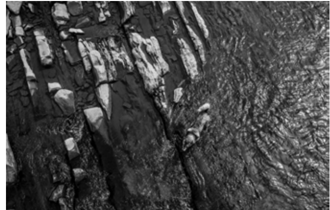
fol. Krystyna Sarnacka