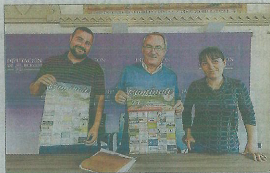
La marcha se presentó ayer en la Diputación, que colabora en la misma.

La salida de la marcha 'Caminate', que se puede hacer andando, corriendo o en bicicleta, como cada participante desee, saldrá a las 10:00 de la Plaza de la Iglesia de Hornillos hasta llegar a San Bol, donde se hará un pequeño descanso y se tomará un refresco, organizado por el responsable del