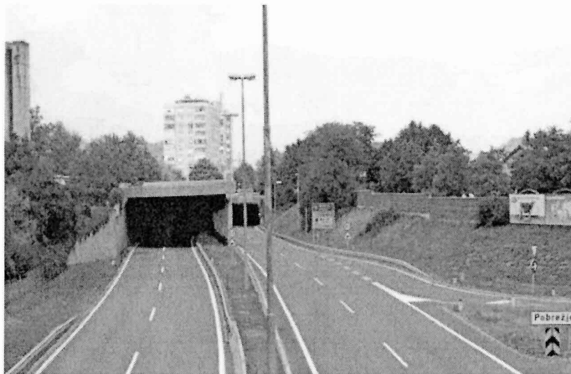
obvoznica skozi Maribor

Mestna občina Maribor je v sodelovanju s partnerskimi organizacijami pridobila sredstva za evropski projekt Resolve iz programa Interreg Europe. V okviru projekta bodo partnerji izmenjavali dobre prakse pri politikah in aktivnostih za zmanjšanje ogljikovih izpustov in drugih onesnaževal pri prevozu blaga v središču mesta.