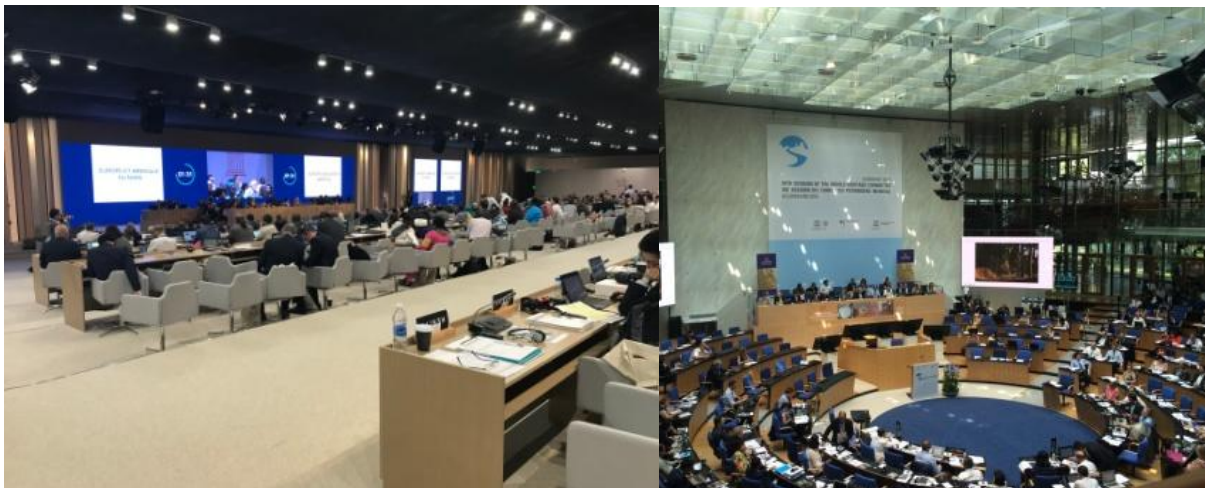
Sitzung des Welterbekomitees in Bahrain 2018 (links), in Bonn 2015 (rechts)

Die 21 Mitglieder des Welterbekomitees sitzen in den ersten Reihen, gegenüber dem Welterbezentrum (u. a. Vorsitz aus Aserbaidschan, Direktorin des Welterbezentrums), den Welterbebüro-Mitgliedern und den Beratungsgremien (ICOMOS, IUCN, ICCROM). Die Besetzung kann je nach Tagesordnungspunkt variieren. Die Sitzordnung der Vertragsstaaten folgt in diesem Jahr dem französischen Alphabet.