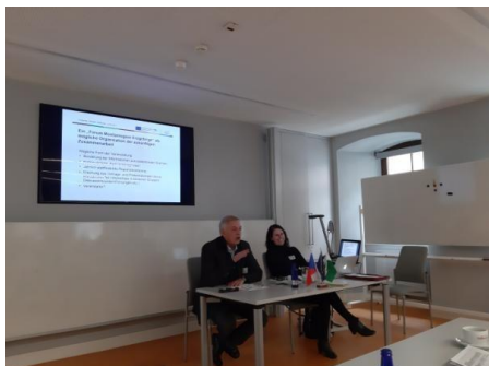
Workshop 5 in Freiberg

Die Konzeption und Organisation übernahm das IWTG, und ganz herzlich möchten wir uns nochmals bei der Arbeitsgruppe „Berg- und Hüttenmännische Schauanlagen“ des Sächsischen Landesverbandes der Bergmanns-, Hütten- und Knappenverein e.V. als Partner der Veranstaltung bedanken.