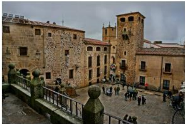
Casca histórico de Cáceres.

Hay el articulista no quiere descansar , sino protestar muy alto. A la mina de uranio a cielo abierto que se pretende abrir en Salamanca, ahora se une otra de litio , también a cielo abierto, a las puertas de Cáceres , una de las ciudades más bellas de Europa. En ambos casos, multinacionales han visto en España un terreno a exprimir como si viviéramos en las comienzos de la Revolución Industrial por el desprecio de nuestras autoridades a la protección ambiental .