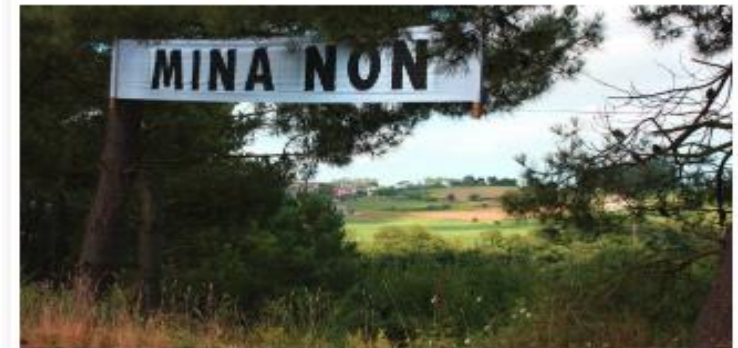
Oposición a la mina de Corcoesto

Una seria advertencia de lo que puede venir. La Sociedade Galega de Historia Natural (SGHN) alerta de los efectos contaminantes y nocivos que la explotación minera a cielo abierto prevista en Corcoesto, y a la que la Xunta dará el visto bueno con su Declaración de Impacto Ambiental, puede provocar en el territorio. Y lo hace aludiendo a un artículo de investigadores del Instituto de Investigaciones Marinas y la Universidad de Vigo sobre los niveles de arsénico en la cuenca del río Anllóns, que demuestran que la antigua mina de oro de esta zona de Bergantiños duplicó ya la cantidad de arsénico presente al atravesar la zona de Corcoesto hasta llegar a la mitad del límite aceptable en aguas para consumo humano.