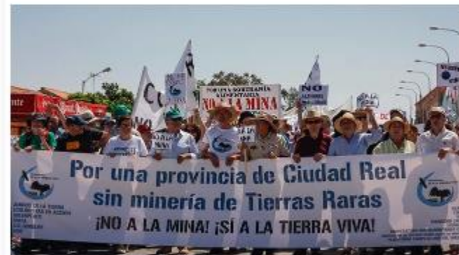
Manifestación contra la minería de tierras raras en mayo de 2016

A casi todo el mundo le pasaron desapercibidos los permisos de investigación que el Gobierno de María Dolores de Cospedal concedía en 2014 para que la empresa minera Quantum pudiera realizar las primeras 'catas' en el Campo de Montiel. Fue en junio de 2015, a punto de cambiar el Gobierno de Castilla-La Mancha, cuando un documento en el Diario Oficial establecía, con el Ejecutivo aún en funciones, que esas primeras operaciones no requerían declaración de impacto ambiental y recibían por tanto luz verde. Con ello empezó un procedimiento administrativo que ha durado casi