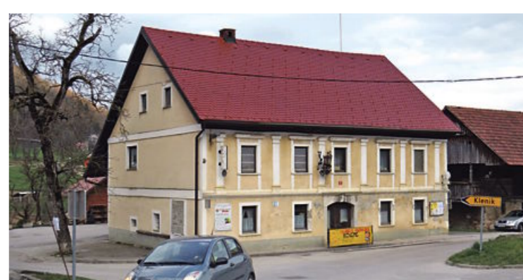
V gledališču Kolenc na Vačah se bodo ukvarjali še s poštinih storitvami.

Vodstvo Pošte Slovenije napoveduje, da preoblikovanje pošt na dostavo pošiljk ne bo vplivalo, saj bodo vse prispele pošiljke naslovnikom na območju Kresnic in Gabrovke dostavljene kot doslej. Sprememba bo le v tem, pravi Zadnik, da bodo pismoonoške locirane na litjski pošti. Vsak dan pismoonoši v Kresnicah dostavijo v povprečju 740 navadnih pisemskih pošiljk, tisti v Gabrovki pa 1080. Zadnik je zavrnil, da se o nameravani preoblikovanju pošt najprej opravili pogovor z županom, šele nato so nadaljevali postopke za preoblikovanje štirih litjskih pošt.