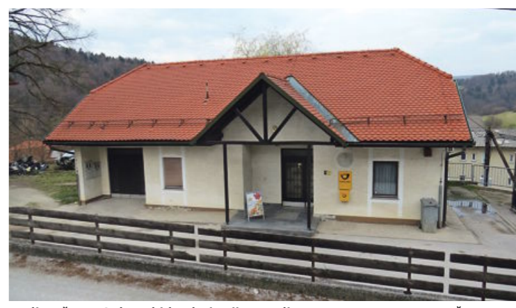
Tudi pošta v Gabrovki bodo junija zaprli.