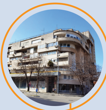
3 ZGRADA LEDARA (1989), arh. Hasan Čemalović, Ulica kardinala Stepinca

PARTISAN MEMORIAL CEMETERY (1965), arch. Bogdan Bogdanović