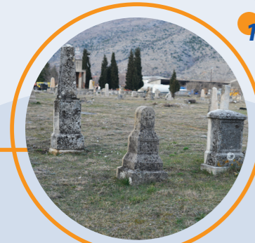
1 AUSTROUGARSKO VOJNO GROBLJE Austrougarski period Bišće Polje bb

Architectural heritage is an important segment of the cultural heritage. Through the architectural route, selected public and private buildings of different styles and epochs are presented. Family villas from the Austro-Hungarian period in the residential areas around Rondo show the influence of Western European architectural schools, while the examples of socialist architecture represent the legacy of the Yugoslav School of Architecture, where local architects favored more modest modernist aesthetics, prefabrication and repetitive modules. Knežić, Bogdanović, Ugljen and Čemalović are just some of the architects who have left a big mark on the architectural heritage of Mostar. Interpretation and presentation of architectural heritage through tourism can contribute to the overall development of these areas.