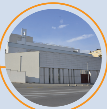
4 DOM UMIROVLJENIH FRATARA (1989, 2004), arh. Zlatko Ugljen Ulica Nadbiskupa Čule

LEDARA BUILDING (1989), arch. Hasan Čemalović, Kardinal Stepinc's street