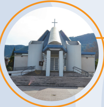
5 KATEDRALA MARIJE MAJKE CRKVE (1972), arh. Hildegard Auf-Franić i Ivan Franić, Ulica Nadbiskupa Čule bb

HOME FOR RETIRED PRIESTS (1989, 2004), arch. Zlatko Ugljen Nadbiskup Čulo's street