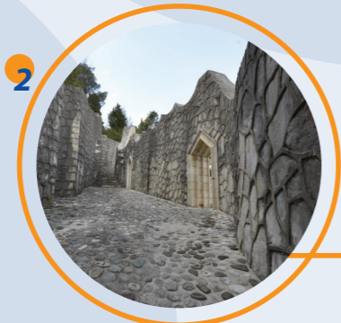
2 PARTIZANSKO SPOMEN GROBLJE (1965), arh. Bogdan Bogdanović

AUSTRIAN HUNGARIAN MILITARY Austrian hungarian period Bišće Polje