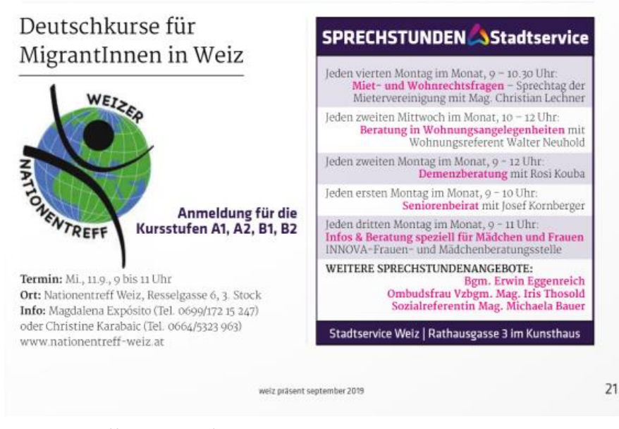
Figure 1 https://www.weiz.at/September_2019

Außerdem erhalten Sie beim Stand des Mobilitätsbüros Informationen zum Thema Mobilität und zu den laufenden Projekten.