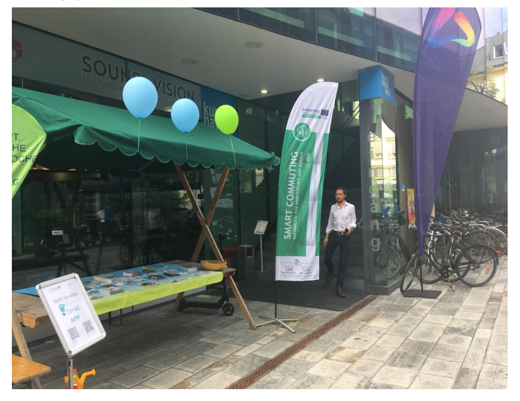
Abbildung 5 Infostand "Bycicle-Day", European Mobilty Week action, in front of the Kunsthaus We