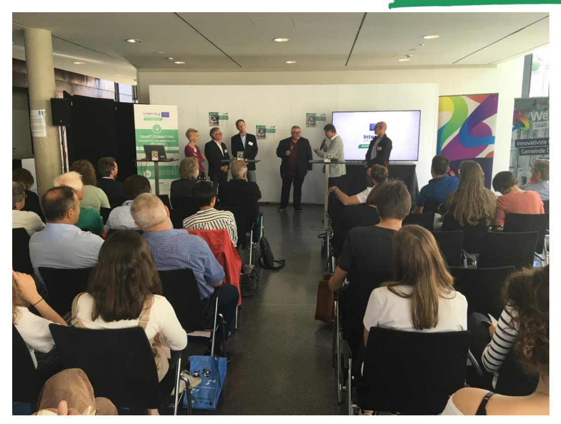
Abbildung 4 panel discussion