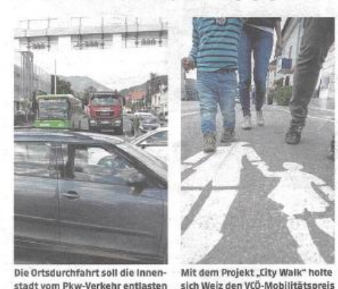
stadt vom Pkw-Verkehr entlasten

aus umliegenden Gemeinden kommen mit dem Pkw. Weiz hat täglich 8500 Ein- und 2300 Auspendler Auf der Gleisdorfer Straße fahren täglich bis zu 20.000 Pkw. 41 Prozent der Schüler der 4. ind 5. Klassen des Bundesschulzentrums fahren selbst per Auto.