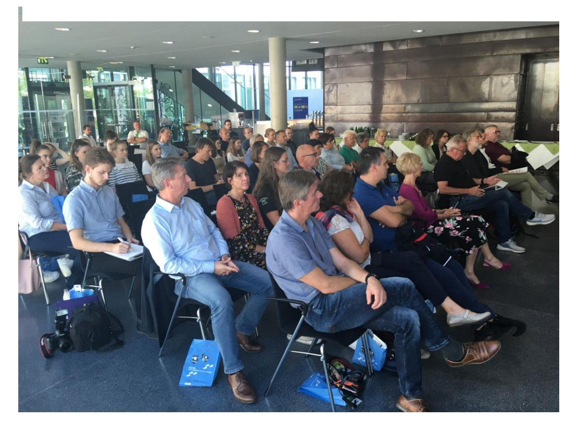
Abbildung 3 Participants