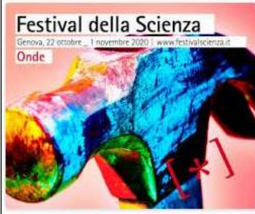
Fig.1: Svoltasi dal 22 ottobre al 1° novembre 2020, la diciottesima edizione del Festival della Scienza di Genova, con la parola chiave Onde/ Organisée du 22 octobre au 1er novembre 2020, la dix-huitième édition du Genoa Science Festival, avec le mot clé Waves.