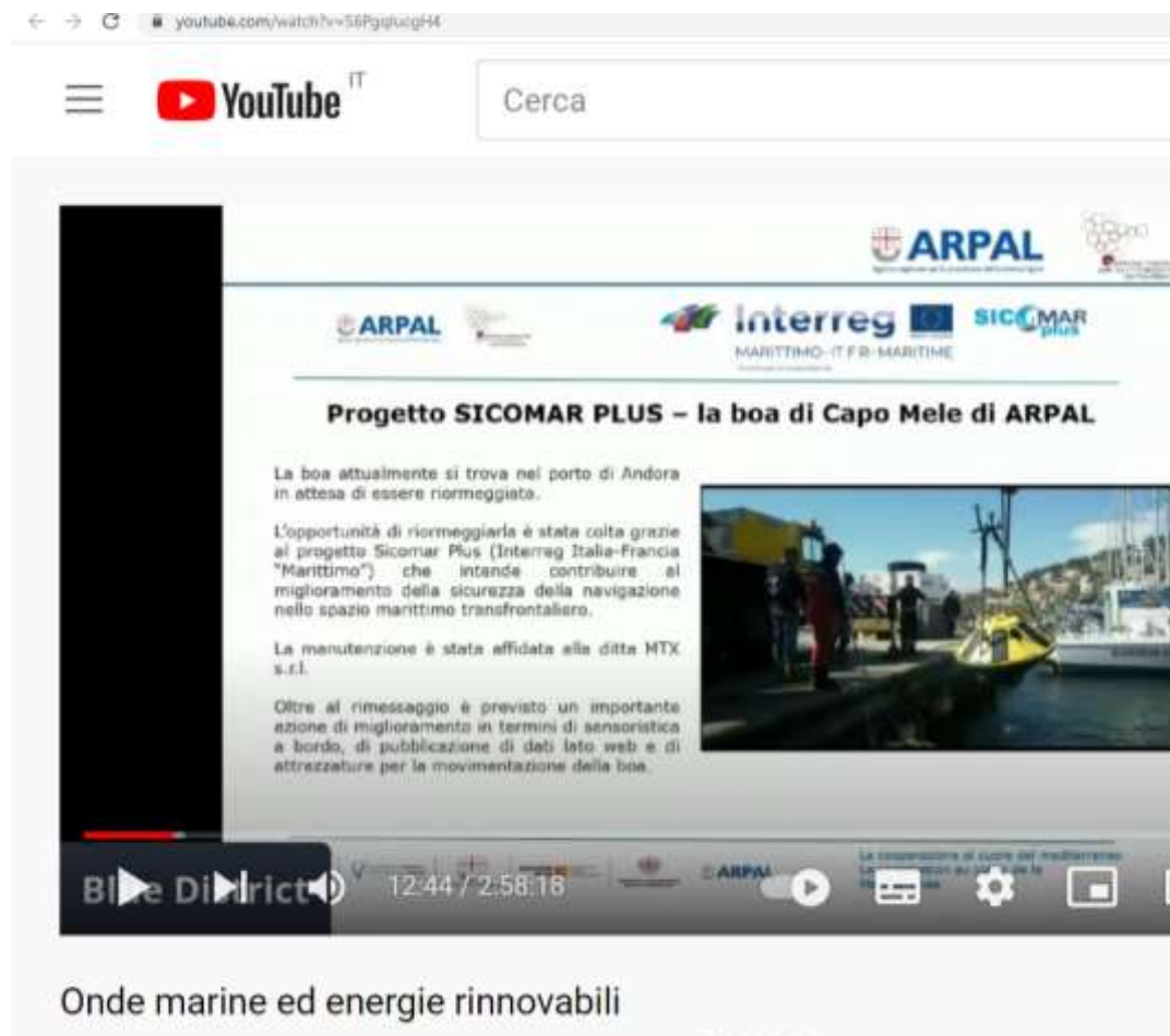
Fig. 5 "Onde Marine ed Energie Rinnovabili" / Ondes Marines et Energies Renouvelables"

https://www.youtube.com/watch?v=S6PgqlucgH4