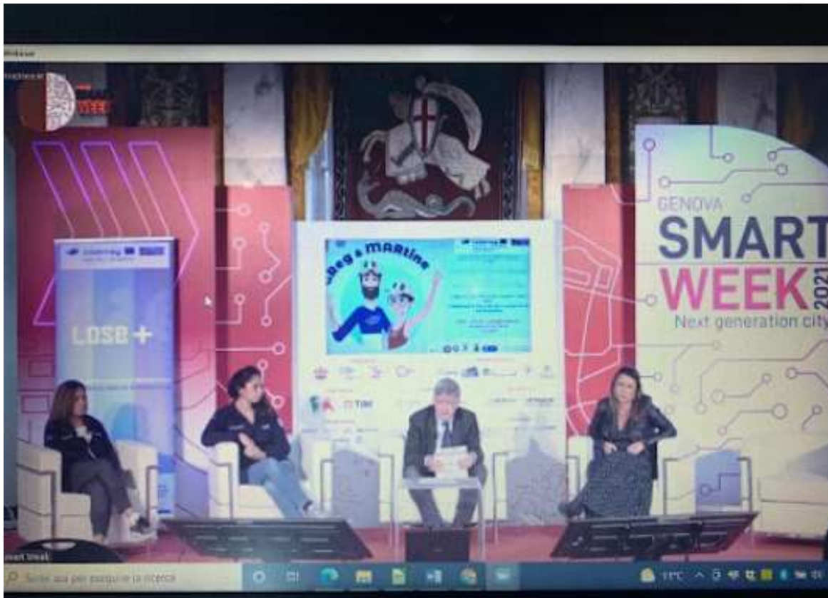
Fig. 10 Evento del Progetto Interreg LOSE+ / Événement du Projet Interreg LOSE +