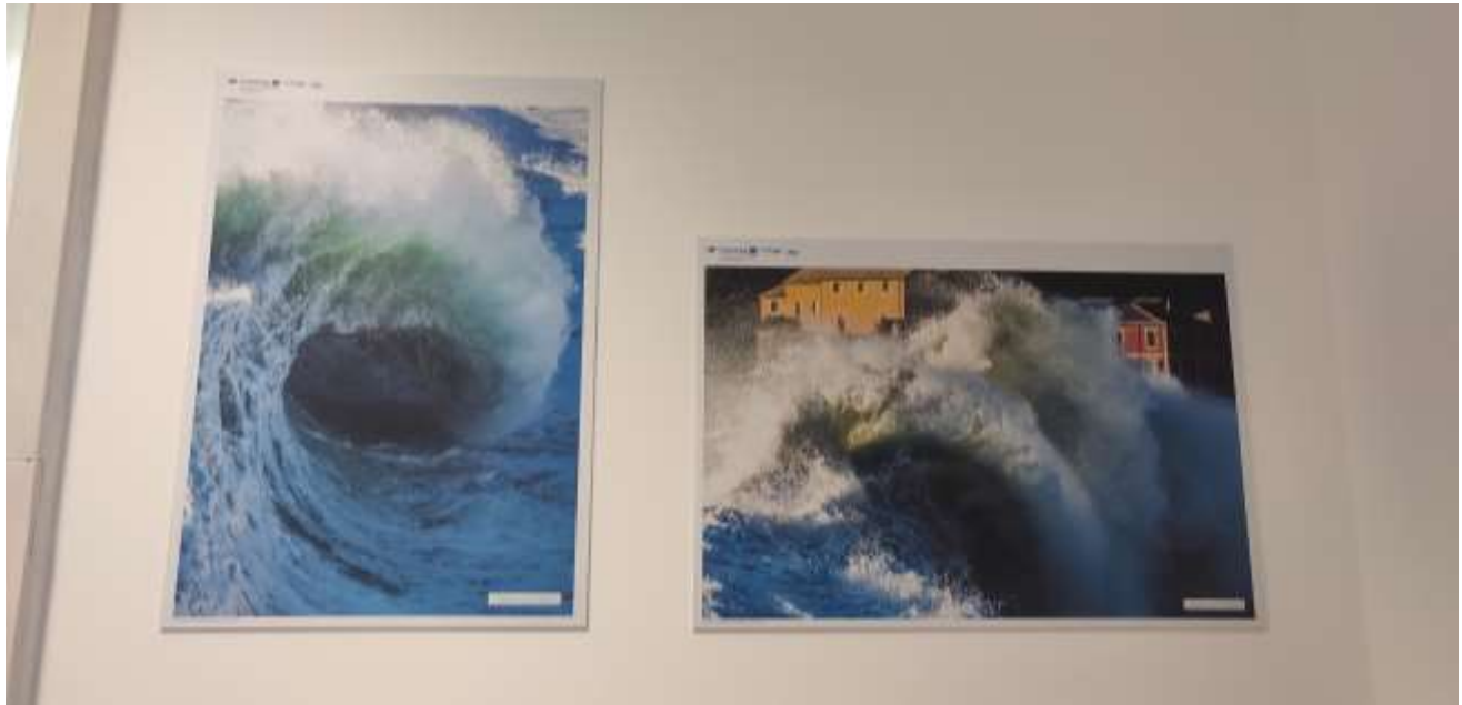
Fig. 7 Poster sala previsioni/ Affiche de la salle des prévisions