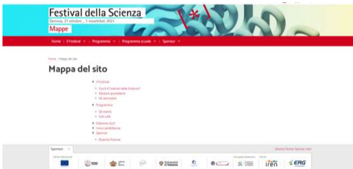
Fig. 11 Svoltasi dal 21 ottobre al 1° novembre 2021, la diciannovesima edizione del Festival della Scienza di Genova, con la parola chiave Mappe/ Du 21 octobre au 1er novembre 2021, la dix-neuvième édition du Festival des sciences de Gênes, avec le mot-clé Maps

Laboratorio dedicato a bambini, bambine e adolescenti/Atelier dédié aux garçons, filles et adolescents.