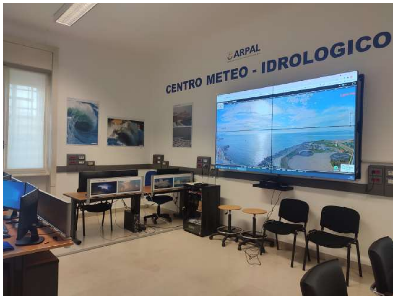
Fig. 6 Nuova sala previsioni/ Nouvelle salle de prévision