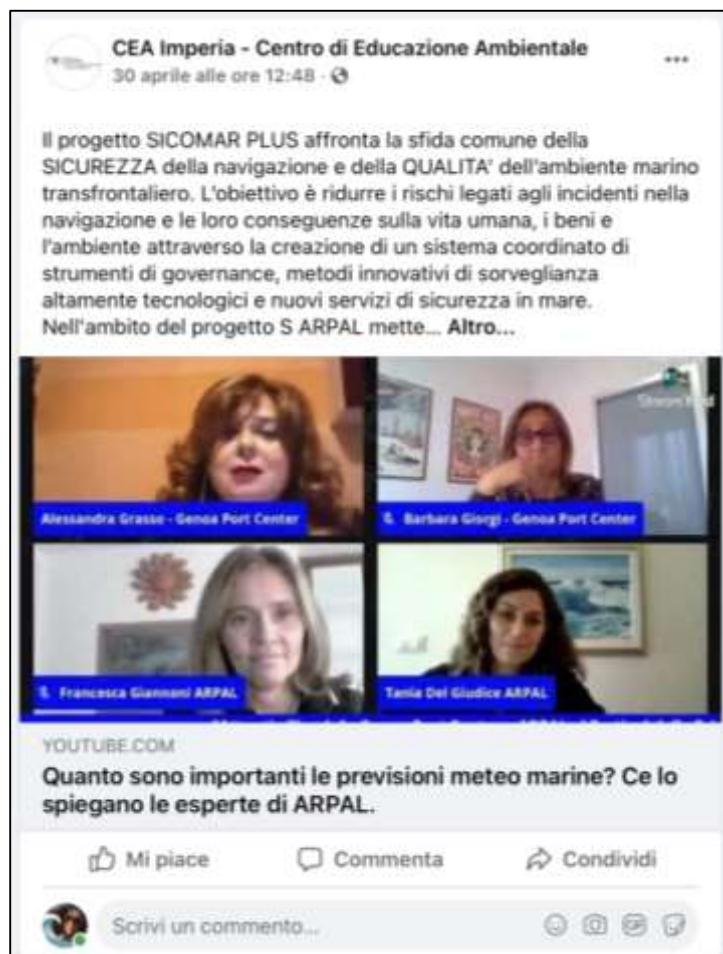
Fig. 4 Il CEA di Imperia posta sui propri canali social il contributo ARPAL/ Le CEA d'Imperia publie sur ses canaux sociaux la contribution de l'ARPAL.

officielle envoyée aux centres d'éducation à l'environnement de Ligurie et aux écoles, concernant la contribution produite par ARPAL sur le mouvement du vent et des vagues dans le cadre du festival de la science.