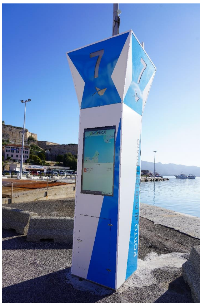
Chiffres 1 Totem 7.