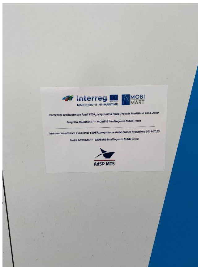
Chiffres 7 Étiquette adhésive au dos de chaque totem.