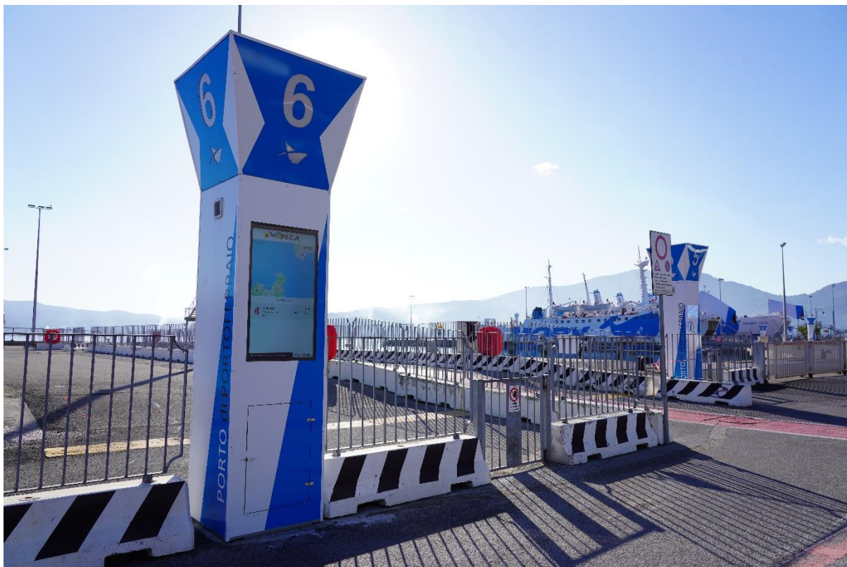
Chiffres 2 Totem 6 et 5.