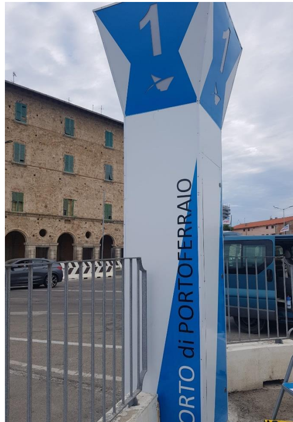
Figure 6 Totem 1.