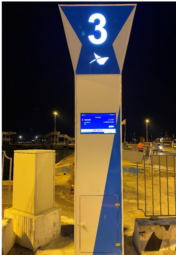
Chiffres 5 Totem 3