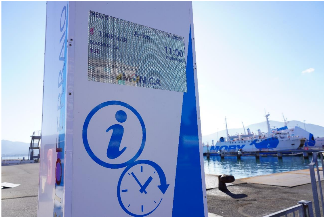
Chiffres 4: Écran totem Alescafo.