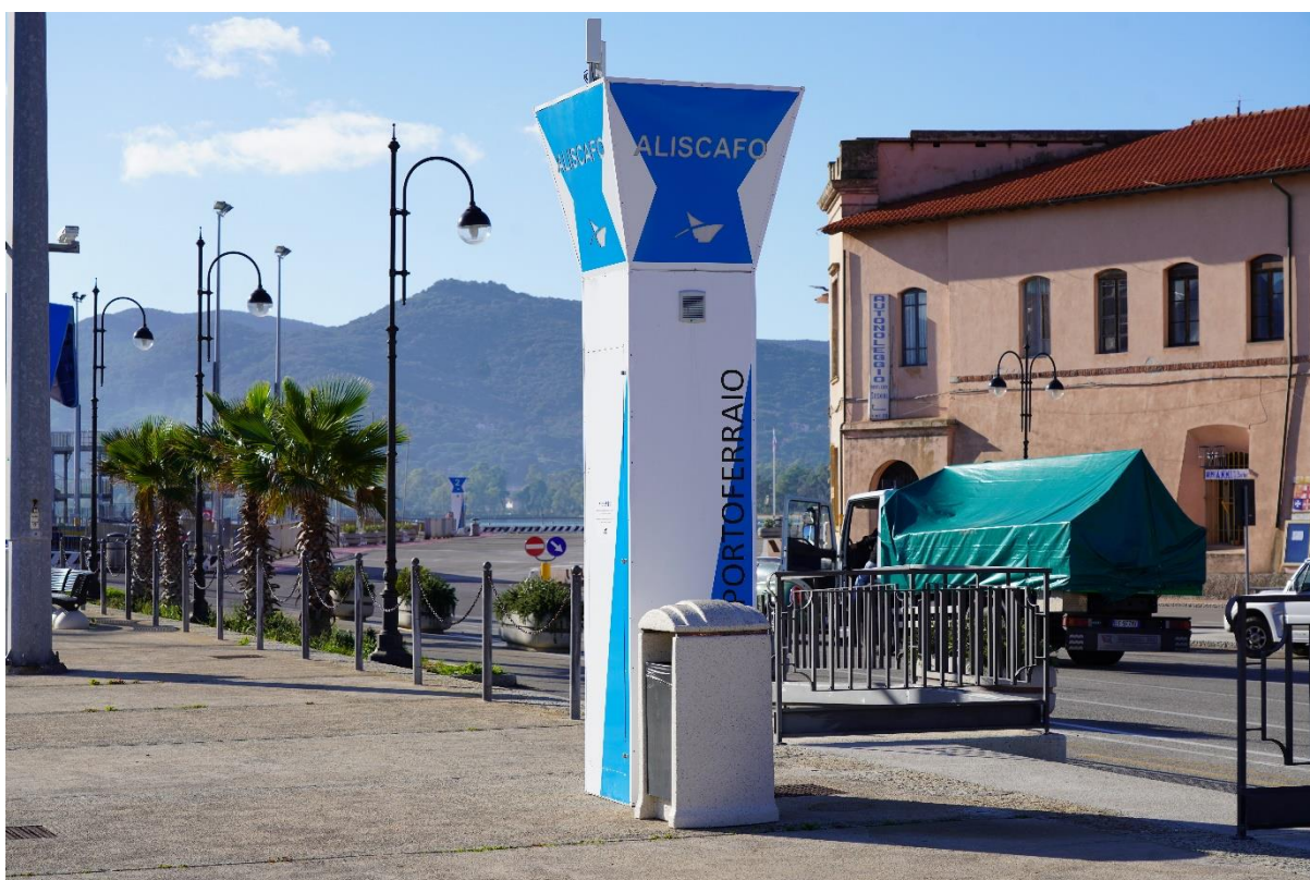
Chiffres 3: totem hydroptère.