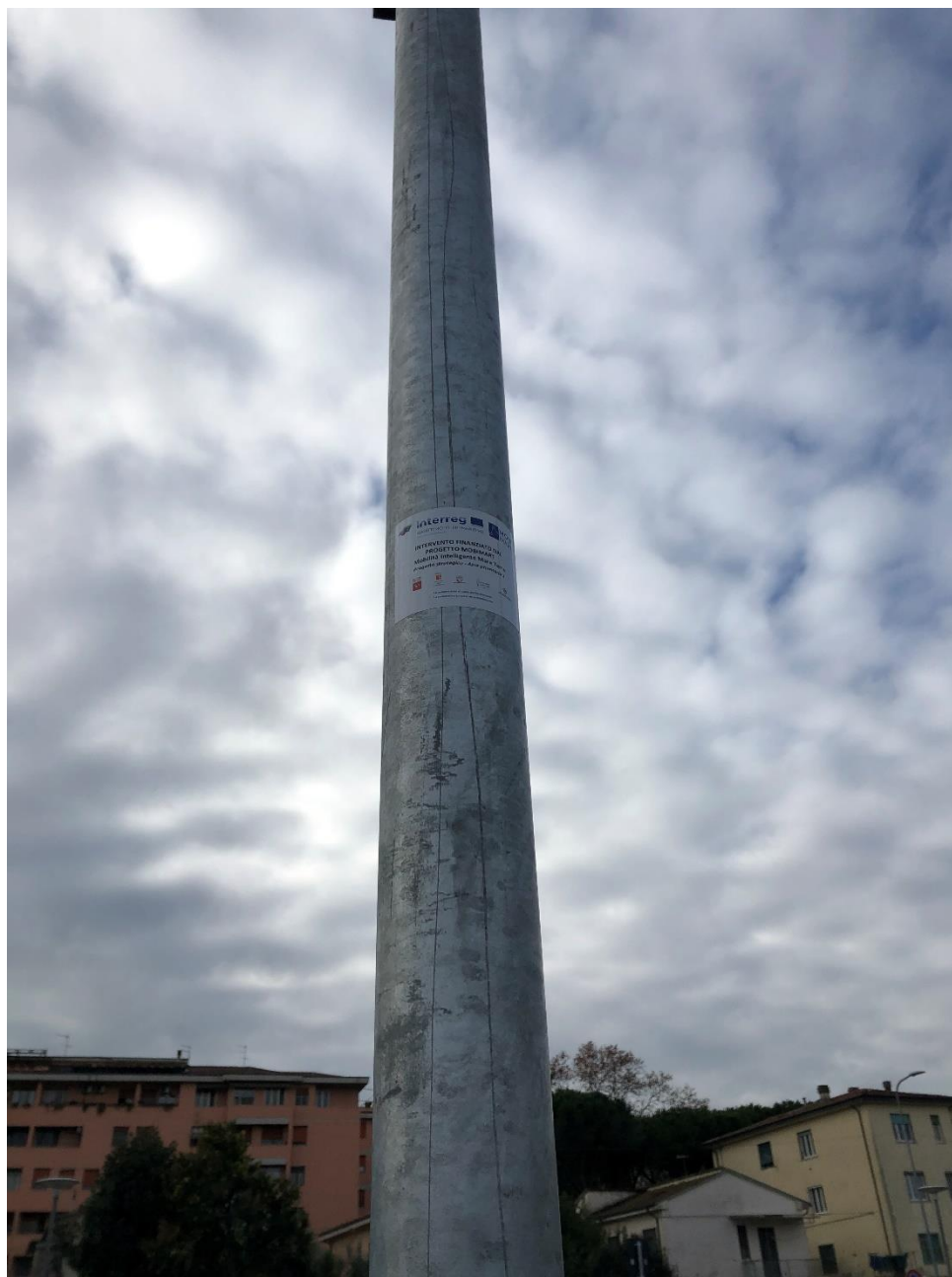
Foto di dettaglio - parcheggio Pratale