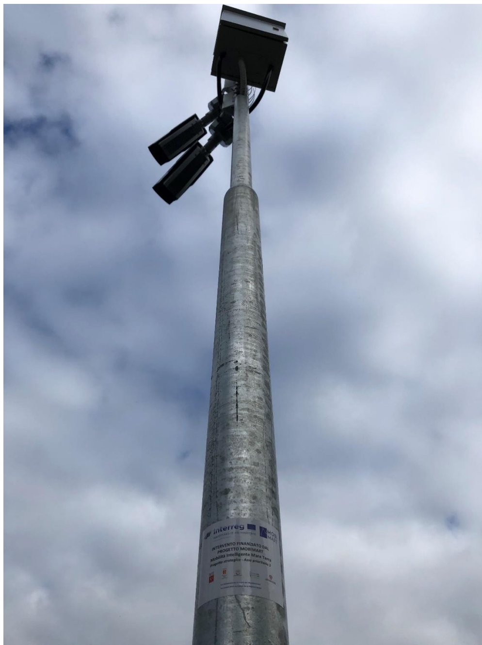
Foto di dettaglio - parcheggio Morrone