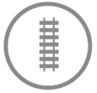
Floorgraphic at the train station “Plauen Mitte”