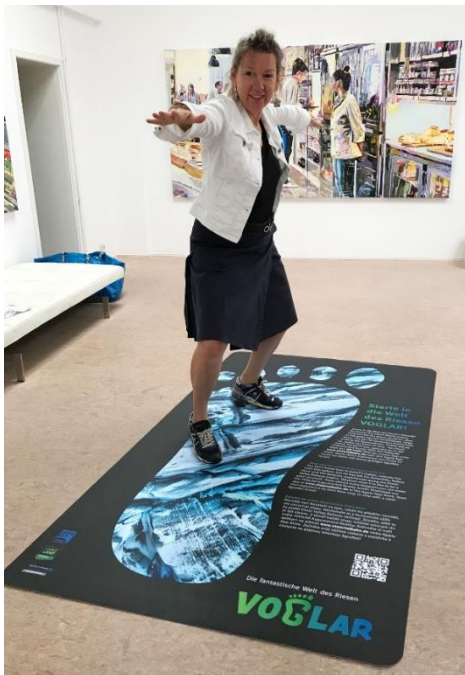
Floorgraphic at the train station "Weischlitz"

Size of an originally used floorgraphic (length approx. 1.90 m)