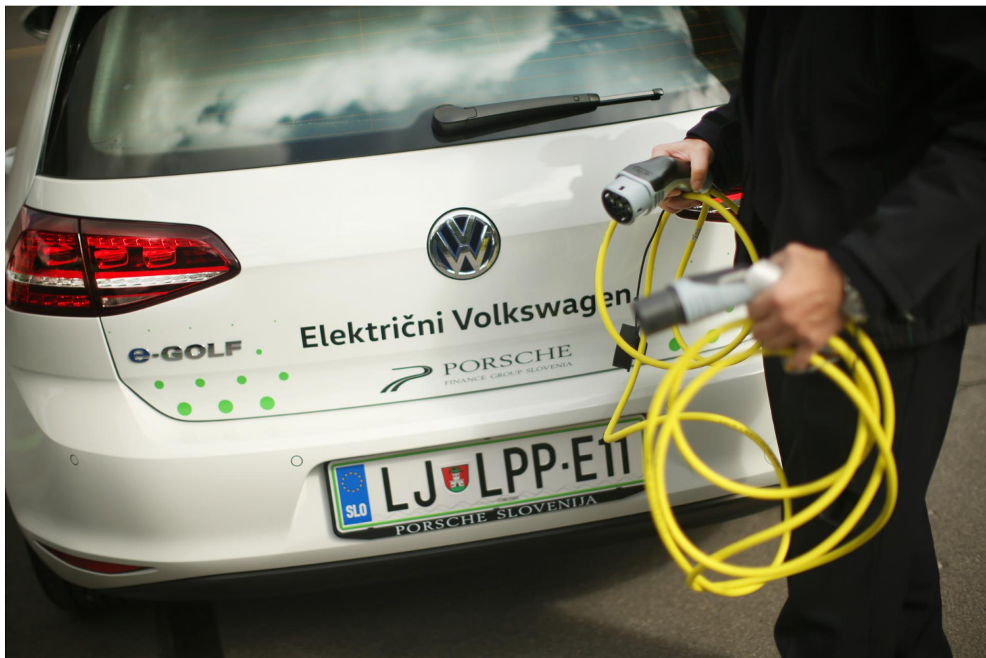
Električna osebna vozila Volkswagen e-Golf v Ljubljanskem potniškem prometu.

LPP je dva meseca opravljal prevoze na klic med 9. in 12. uro ter med 16. in 22. uro, zahtevo za prevoz pa je moral uporabnik po telefonu sporočiti najmanj dve uri pred vožnjo. Prevoz na klic na Škofljici je bil plačljiv z enotno mestno kartico urbana po veljavnem ceniku vozovnic v mestnem in integriranem potniškem prometu LPP za prvo območje (1,30 evra) in je omogočal prestopanje v roku ure in pol.