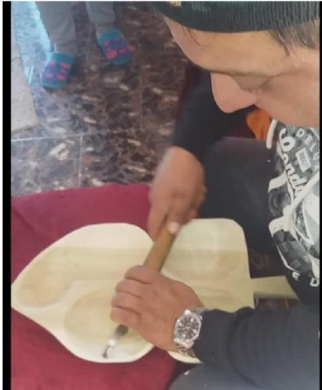
Trasul la scoabă