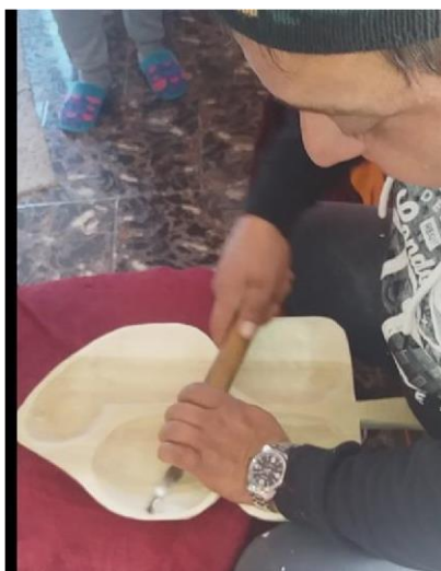
Platou din lemn