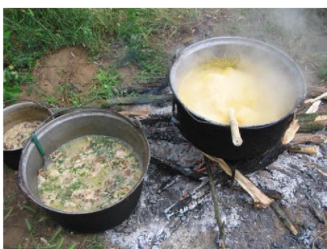
Drob țigănesc și mămăligă

miei și țin în mâini lumânări. În timpul sacrificiului cântă lăutarii, iar bărbații care sacrifică mieii se închină cu față către Răsărit. Femeile care au făcut bradul colectează în farfurii sângele mieilor sacrificați și fac cu acest sânge un punct pe fruntea copiilor, punct care va purta noroc și va proteja copiii de rău pe parcursul întregului an. Pentru ca sacrificiul să aibă efect, sângele mieilor este strâns de femei în vase noi, direct de la gâtul tăiat al mieilor și nici o picătură de sânge care curge din gâtul mieilor nu trebuie să atingă pământul pentru a nu impurifica sacrificiul. Organele mielului se fierb împreună cu intestinele, se toacă mărunt, se amestecă cu verdeață și se prepară așa numitul drob țigănesc care se împarte copiilor de pe stradă.