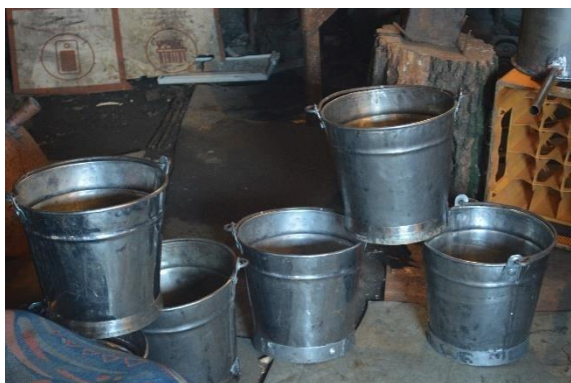
Găleți de tablă lucrate manual