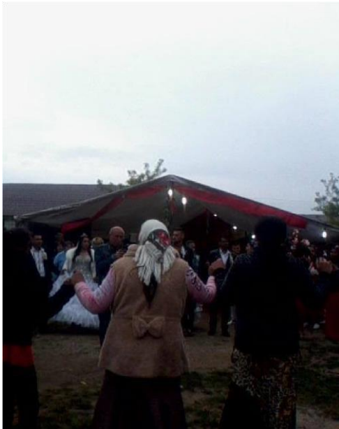
Nuntă tradițională în județul Dolj; Sursa foto: arhiva personală

Atâta timp cât sunt în viață, bătrânii sunt adevărații conducători ai familiei, și toți ceilalți trebuie să le dea ascultare. Bărbatul familiei are rol de relaționare a familiei cu exteriorul, în această atribuțiune având libertate și prerogative depline. Femeia are rol de organizare a tuturor activităților privitoare la funcționarea internă a familiei și la creșterea și educarea copiilor. Ea trebuie să aducă pe lume copii mulți și sănătoși, principalul deziderat al unei familii rromice. Din aceste considerente, sterilitatea unei femei apare ca principal motiv pentru care un bărbat poate să ceară desfacerea unei căsătorii deja declarate și cunoscute de către comunitate.