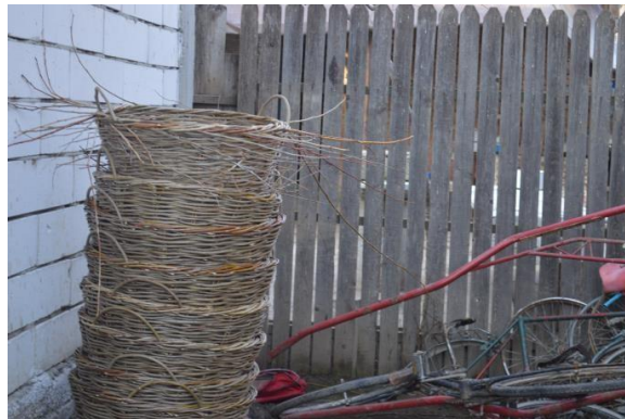
Obiectele pe care le vinde în piețe și târguri din Craiova și împrejurimi