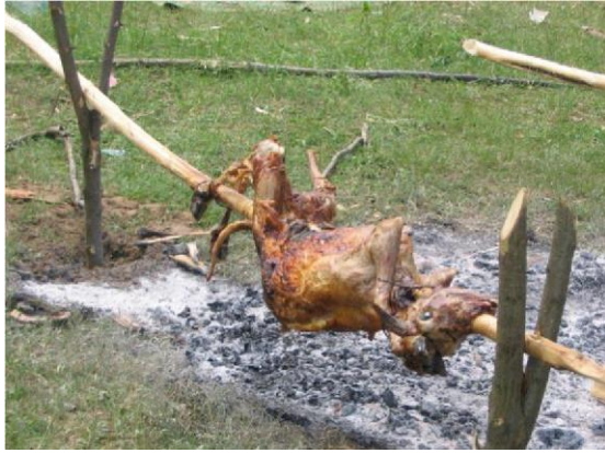
Berbecuț la proțap pregătit de Gurban.

După ce se mănâncă, toată mâncarea care rămâne se îngroapă și se acoperă cu frunzele de plop sau de stejar.