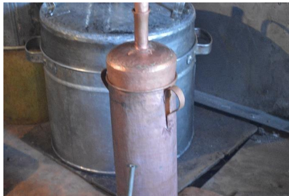
Казан за ракия

Това, което се прави ръчно, е много трудно да се постигне, казва майсторът и тази работа не е много добре платена в сравнение с истинската стойност. Сега е по-лесно, отколкото преди, защото не прави наставките като лястовича опашка, зачервява материала и след това го чука. Сега е заваряване в автогенен.