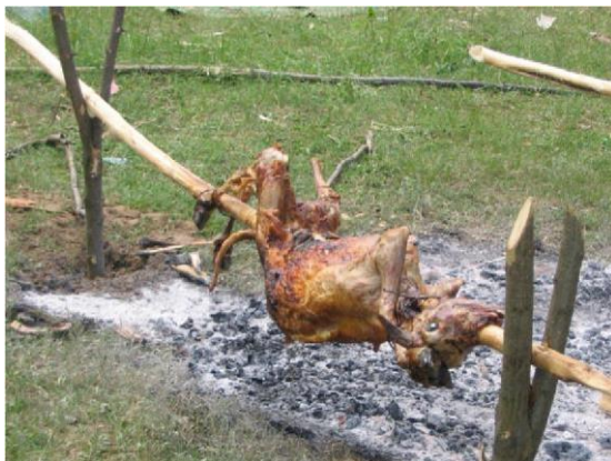
Шиле на чеверме за Курбан.

Шилето или шилетата, в зависимост от случая, трябва да са бели, за да представят чистотата и невинността, и преди да отидат на масата, се прави желание, обикновено най-старата от рода агне за човека, за когото е приготвена, като конкретно желание на че само старейшините го знаят и се предава от поколение на поколение.