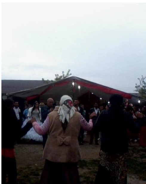
Традиционна сватба о окръг Долж

дава на дъщеря си зестра, с това, което той е получил от бащата на момчето по повод на годежа.