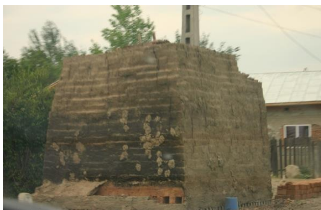
Пещ за тухли

След като брега (земята се издига), земята се използва за тухла, брега се изкопава, бута се и се използва за "зона". Районът се нарича още „банкетно огнище“. Майсторът казва, че това е истинско изкуство реденето на тухлите. От там можете да видите колко добър е един тухлен занаятчия. Тухлата трябва да се постави в "банкета", за да се преброи леко и да се изпече правилно, за да бъде с добро качество. 125 тухли се поставят на 8 реда и така 1000 тухли.