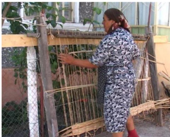
Стан за тъкане на рогозка