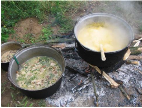
Цигански дроб и качакам