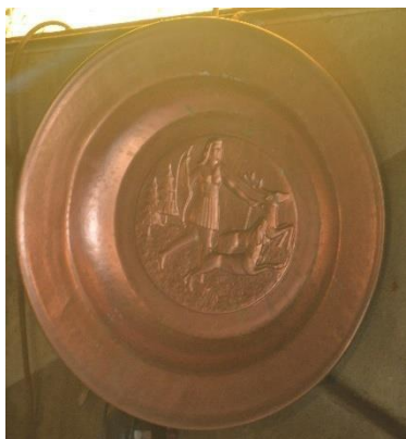
Ръчно изработена чиния

железен листове. Плащането за тях се договаря с клиента, понякога той прави размяна. Ако хората нямат пари, майсторът също получава продукти: кокошки, прасета или други животни от двора. Например, един меден казан го прави за 5 дни и го продава с 35-40 милиона (3500-4000 леи).