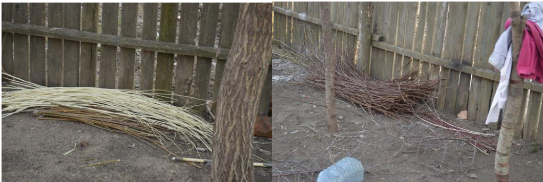
Набрани клонки от брега на река Жиул, оставени да се изсушат