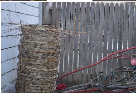
Предмети, които продава на пазари и панаири в Крайова и околностите