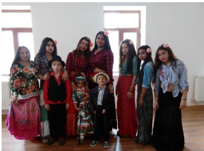
Танцова група заедно с ромски деца