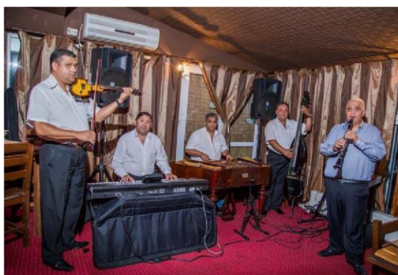
Тараф Пууу Букътару на частно парти

През 1995 г. е сформирана тарафа Пууу Букътару. В момента групата се състои от 4 инструменталисти и двама вокалисти: Андруш - цимбал, Джордже Чоака-контрабас, Кристи Палеа-цигулка, Разван-орга, Пууу-кларинет и глас и Мона Идолу-солист.