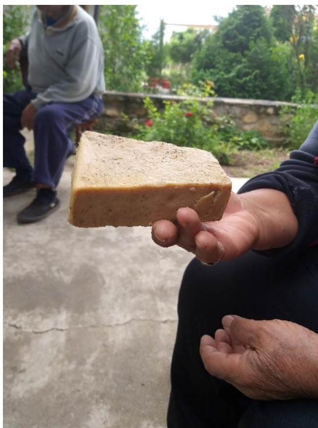
* săpun de casa