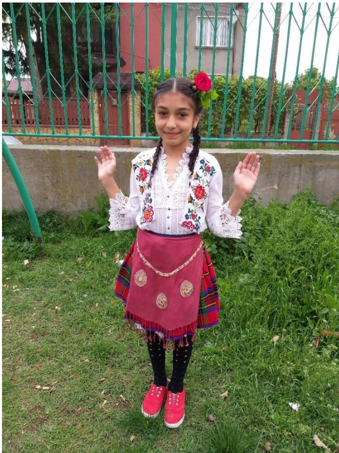
*Lazarka în cartierul Drumul nou, oraș Vidin

În cartierul rom "Drumul nou" din Vidin, pe lângă ritualurile asociate cu mielul, se poate vedea de Ziua Sfântului Gheorghe și lazarki. Fetele îmbrăcate în costume populare, cu flori în păr, se plimbă în jurul caselor, cântă și dansează. În grup este și o mireasă și responsabilă pentru ciauul plin cu apă și monede. Ei cântă pentru sănătate și urează bunăstare gazdelor. În schimb, primesc bani și dulciuri. Acest obicei a fost îndeplinit de-a lungul timpurilor, de generațiile anterioare .