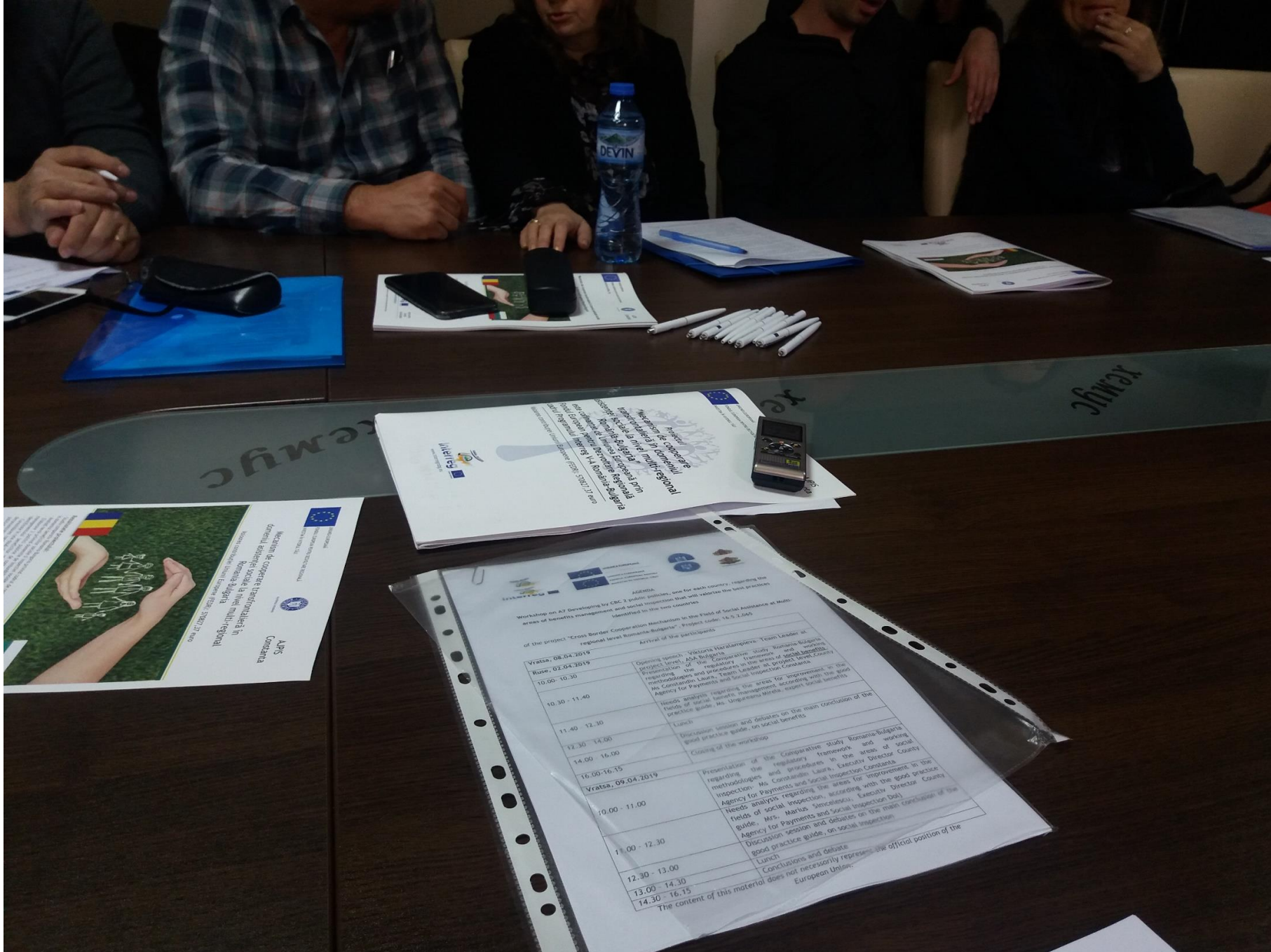
Conținutul acestui material nu reprezintă în mod necesar poziția oficială a Uniunii Europene