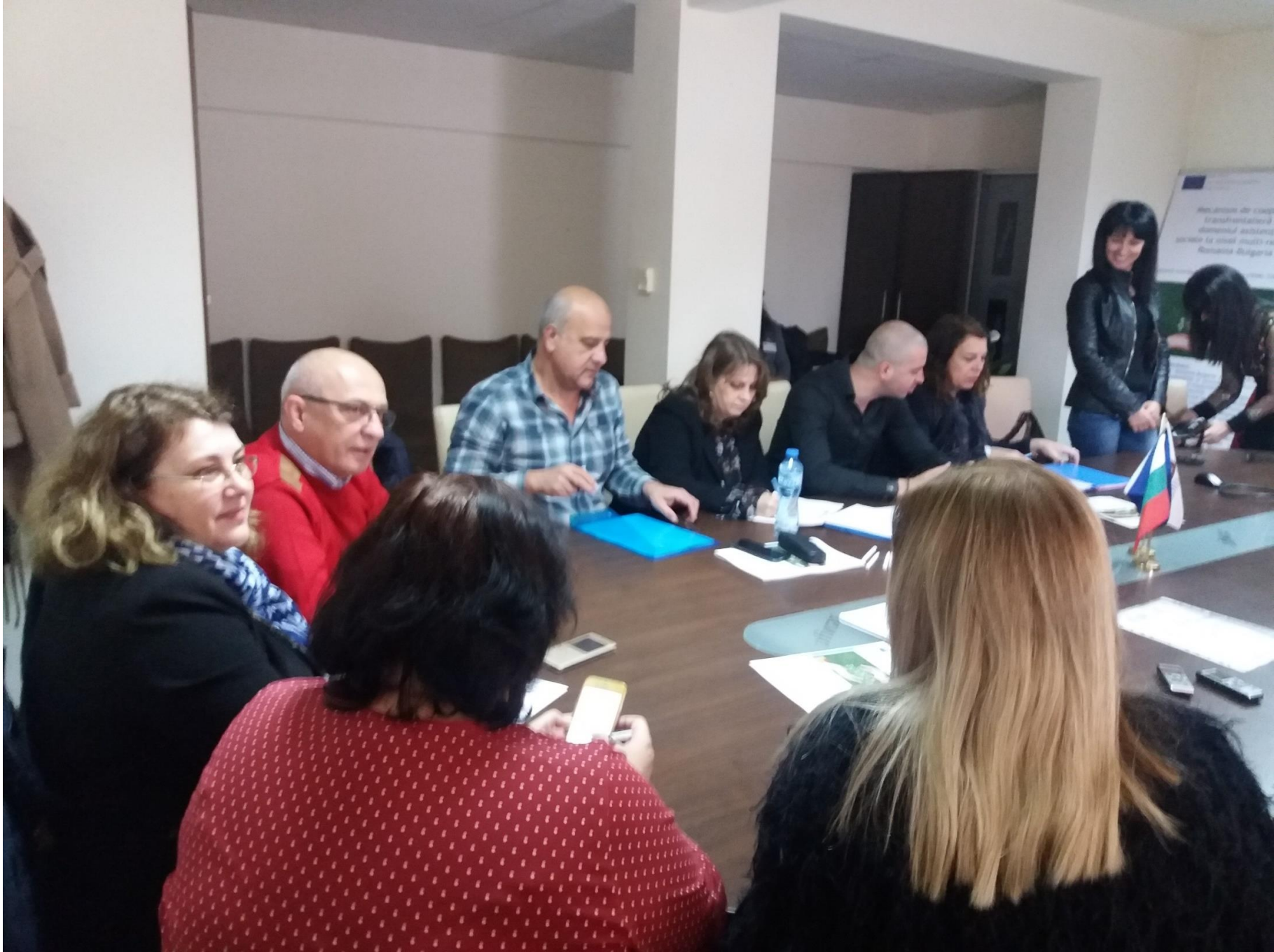
Conținutul acestui material nu reprezintă în mod necesar poziția oficială a Uniunii Europene