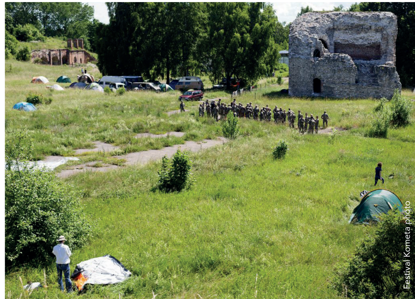
Festival Kometa photo

Cietoksnis ir daļēji publisks un atspoguļo jaunu īpašumtiesību tipoloģiju, kas ļauj vairāk iesaistīties un gūt piederības sajūtu vietējai kopienai. Tā ir ārkārtīgi interesanta tipoloģija, kas jāizpēta, jo šī koncepcija tiek pētīta citās sociālajās/kultūras kopienās Eiropā.