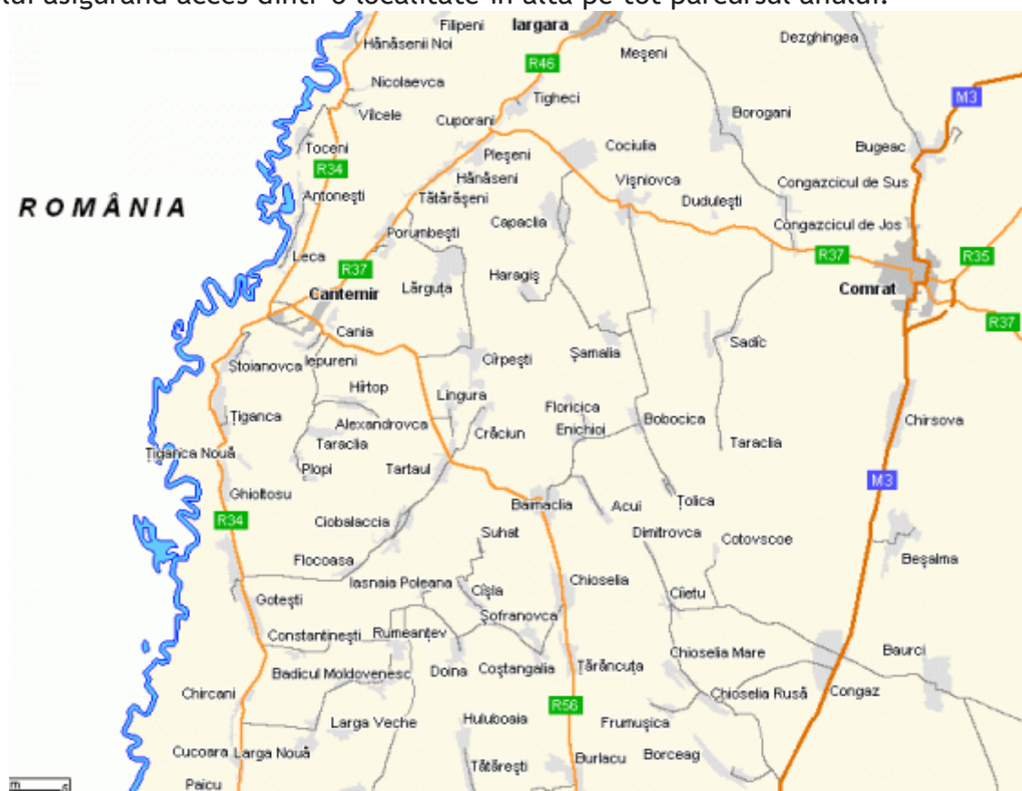
Figura 2 Rețeaua de acces în raionul Cantemir

Drumurile naționale traversează teritoriul raionului pe o lungime totală de 96,86 km. Totodată, drumurile locale de acces constituie 186,15 km și fac conexiune între localitățile raionului asigurând acces dintr-o localitate în altă pe tot parcursul anului.