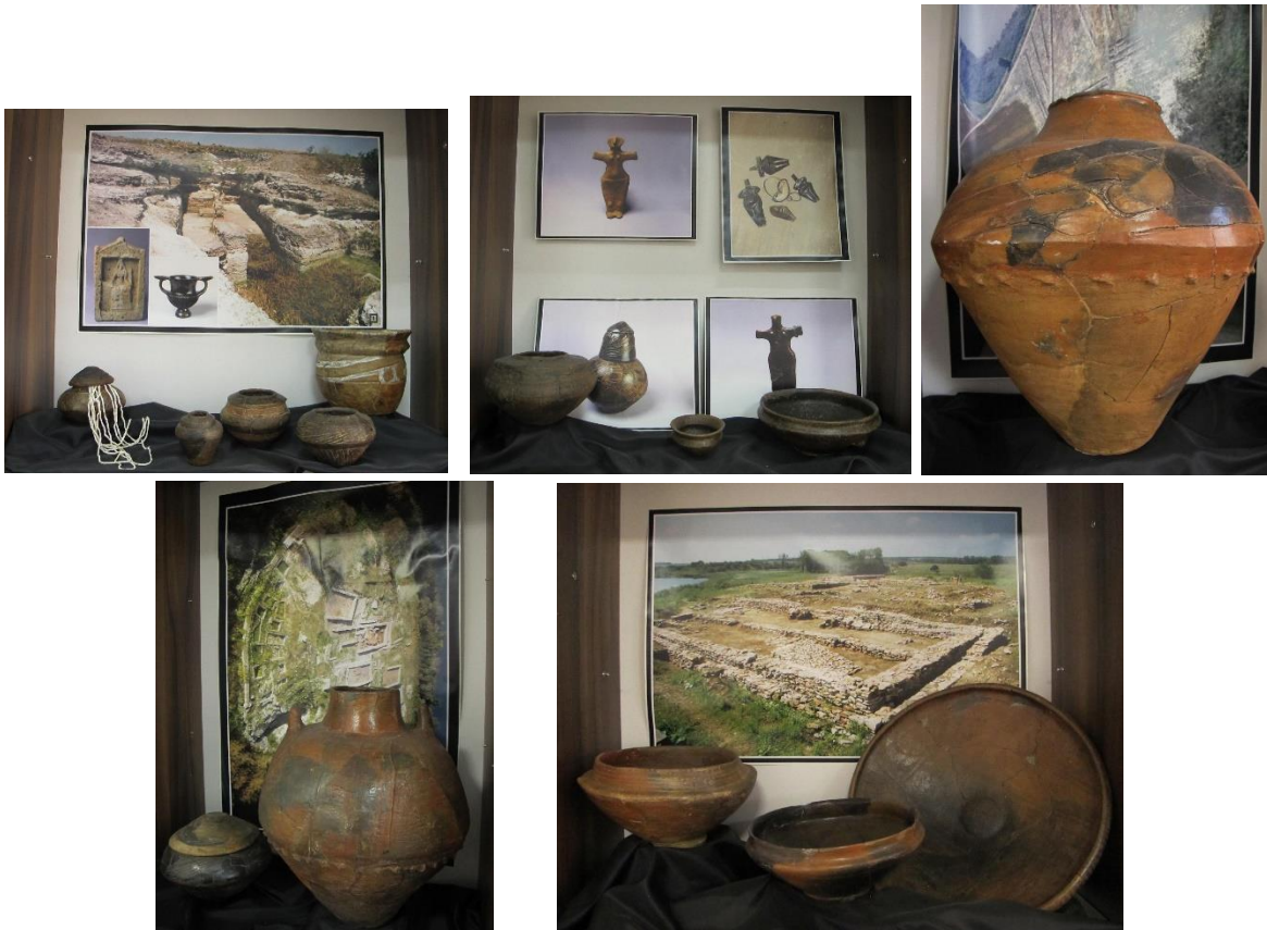
Vase ceramice găsite în complexul arheologic Durankulak, cultura Hamangia III, mileniul 5 î.Hr.

mort. Ele sunt concepute pentru a calma spiritul unui membru al comunității, care a murit sau a fost decedat departe de rudele sale.