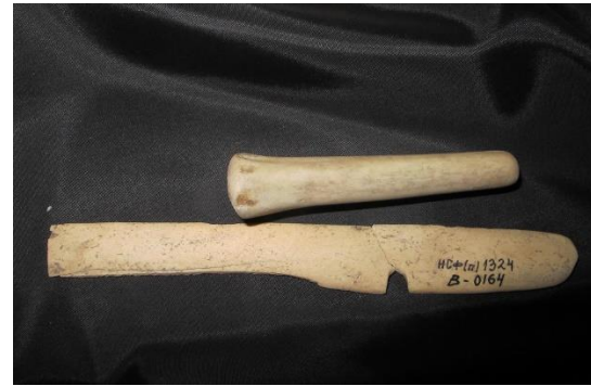
Unelte găsite în Complexul Arheologic Durankulak, cultura Hamangia III, mileniul 5 î.Hr.

Relațiile complexe care au apărut schimbă radical toate sferile comunităților preistorice. Industriile autohtone care existau până atunci se transformă în meșteșuguri. Apar ocupații - membrii societății încep activități individuale legate de diferite aspecte ale sistemului economic. Producția de masă începe - producția de produse uniforme sau similare într-o serie pentru a satisface nevoia de produse similare de către o gamă mai restrânsă sau mai largă de consumatori. Începuturile acestui sistem datează din neolitic, dar s-a format în cele din urmă în epoca cuprului, când „masificarea” producției a afectat nu numai metalurgia, ci și ceramica, țesutul, prelucrarea mineralelor, producția de oase și bijuteriile din cochiliile moluștelor marine. Există o tranziție de la implicarea individului în activități colective la o activitate specializată care necesită muncă independentă. Schimbarea generală este orientată spre valorificarea abilităților personale ale fiecărui membru al societății.