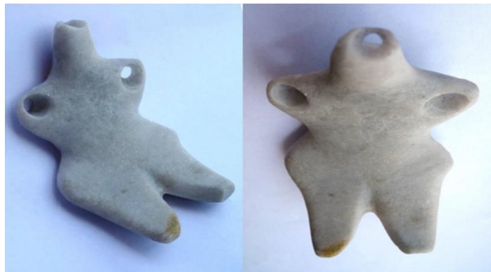
Cernavoda - pandativ de marmură antropomorfă

Preferința pentru materialele animale poate fi corelată cu natura predominant pastorală a economiei Hamangia. De exemplu, multe ornamente au fost făcute din oase de Ovis, reflectând importanța acestor animale în viața de zi cu zi a comunității.