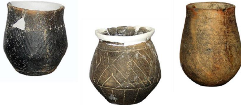
Cernavodă, Mangalia, Limanu - ceramică

Astfel, cultura Hamangia, prin complexitatea și rafinamentul său artistic, servește drept exemplu elocvent al evoluției artei ceramice în sud-estul Europei. Nu este doar o reflectare a abilităților tehnice, ci și a valorilor și credințelor comunităților care au trăit în acea perioadă 8 .