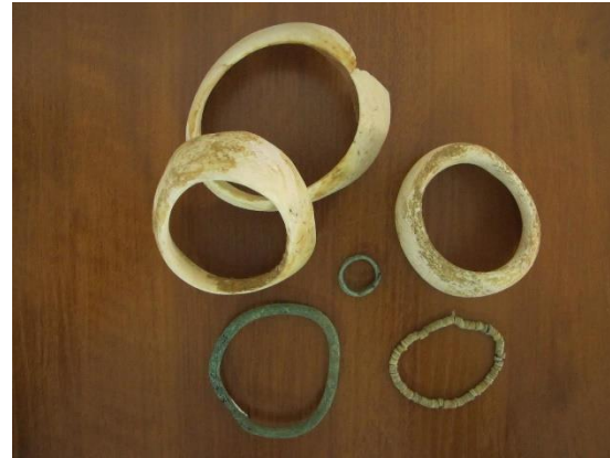
Bijuterii și instrumente găsite în complexul arheologic Durankulak, cultura Hamangia III, mileniul 5 î.Hr.

Astfel, într-o perioadă relativ scurtă de existență - de ordinul a aproximativ 600 de ani - o cultură arheologică trece metamorfoza sa de la un fenomen arhaic și înapoiat la un motor progresiv și conducător al proceselor economice și sociale din jumătatea estică a Peninsulei Balcanice. Cu toate acestea, dezvoltarea sa nu se termină aici. Purtătorii culturii Hamangia încep cel mai viu și mai dezvoltat fenomen european preistoric - cultura Varna, în cadrul căreia, în a doua jumătate a mileniului 5 î.Hr., toate realizările sale vor deveni și mai pline de farmec și vor da un impuls inițial primei protocivilizări europene.