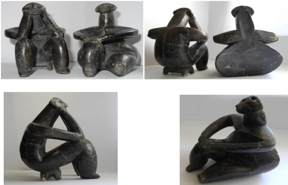
Cernavodă - Gânditorul și femeia așezată

Cultura Hamangia, deși descoperită mai târziu decât alte culturi neoeolitice, a devenit rapid populară, Gânditorul și partenerul său fiind emblematice pentru civilizația europeană timpurie. Contextul exact al descoperirii acestor două figurine rămâne neclar, dar se crede că ele au făcut parte dintr-un mormânt 6 .