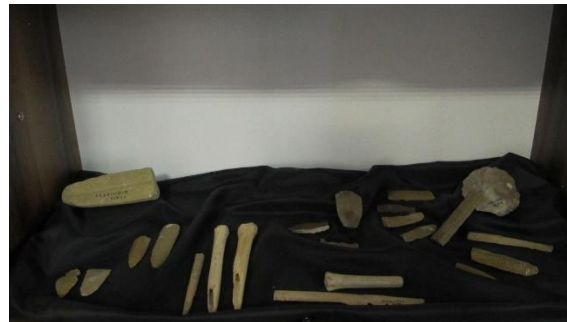
Unelte găsite în Complexul Arheologic Durankulak, cultura Hamangia III, mileniul 5 î.Hr.