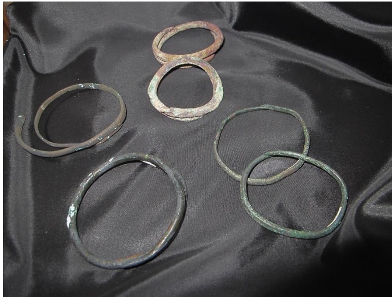
Bijuterii găsite în complexul arheologic Durankulak, cultura Hamangia III, mileniul 5 î.Hr.

Ultima, a patra fază a culturii Hamangia este unul dintre cele mai bine cercetate fenomene teritoriale și cronologice de pe teritoriul Bulgariei. Deși nu există încă publicații sumare pe această temă, imaginea dezvoltării societății Hamangia târzii, care a trăit în epoca Halcoliticului Mijlociu, poate fi reconstruită cu mare fiabilitate și detalii.