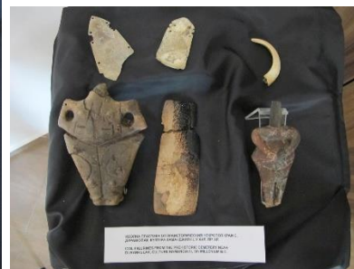
Sculptură în idoli din necropola preistorică din complexul arheologic Durankulak, cultură Hamangia III, mileniul V î.Hr.

Arta plastică a culturii Hamangia, parte a eneoliticului balcanic, se distinge prin stilul său abstract, cu siluete umane reduse la forme geometrice. D. Berciu a clasificat aceste figurine în trei tipuri principale: tip A (figurine așezate), tip B (figurane așezate) și tip