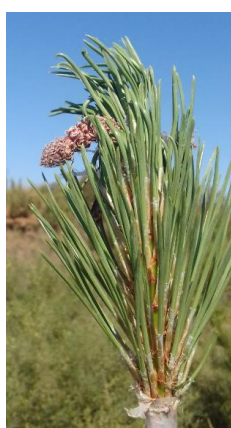
Clone 3057 orange