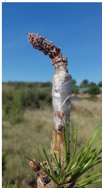
Clone : 3084 orange