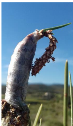
Clone 6053 bleu