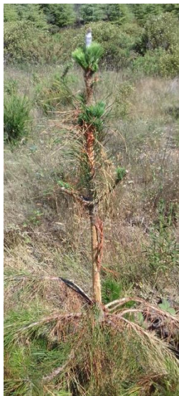
Plant ayant subi un écorçage