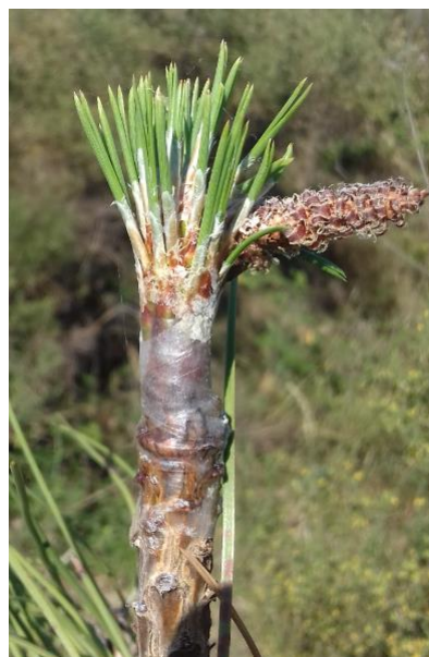
Clone 3084 orange