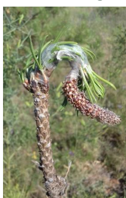
Clone 2004 orange