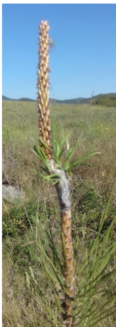
Clone 3084 orange