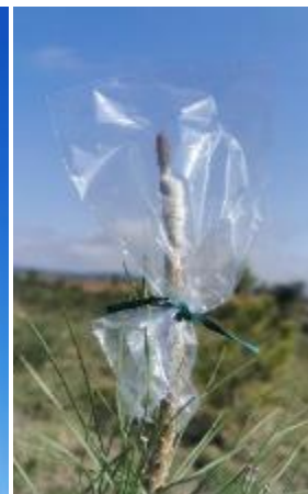
Photo 3 : Modèle des poches utilisées en remplacement. Modèle rigide, idéale.