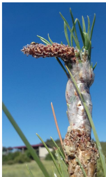
Clone 3084 orange