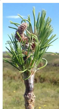
Clone 1073 bleu