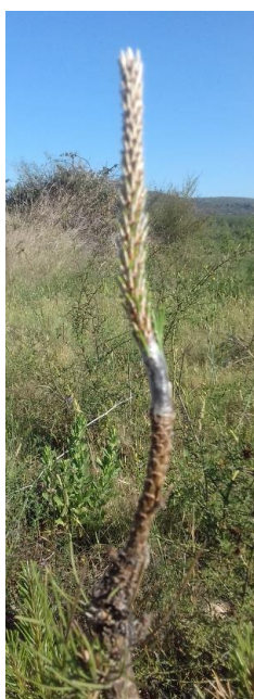
Clone 3063 Bleu