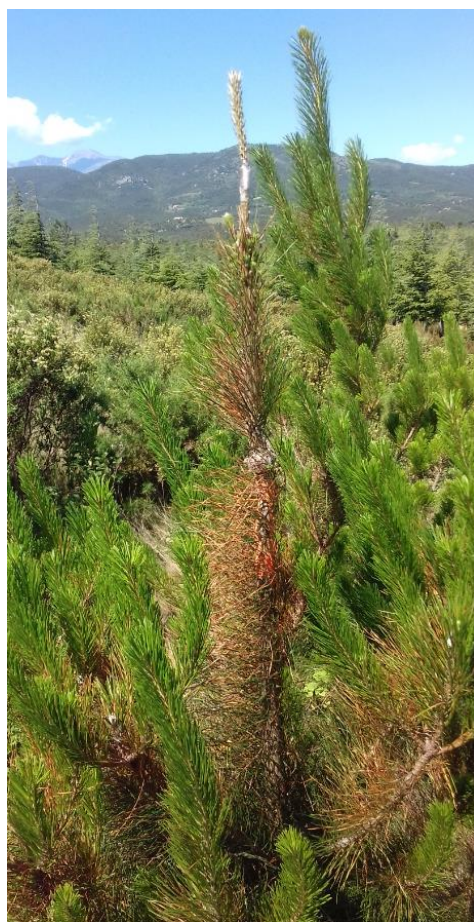
Exemple d'un plant à aiguilles rouges

1 plant a subi un écorçage de chevreuil.