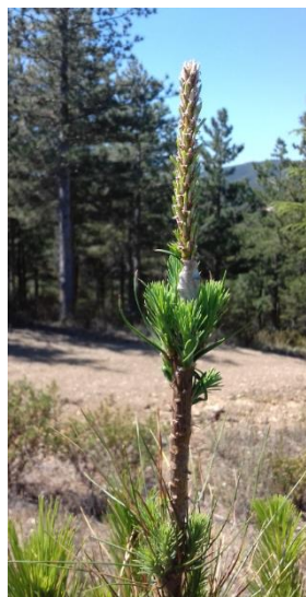
Exemple d'un greffage réussi