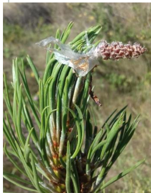
Clone 3063 Bleu