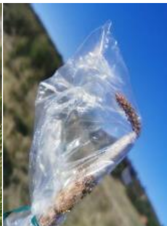
Photo 2 : Modèle des poches très souples. Plastique qui se "colle" au greffon et qui "force" sur le greffon à cause du vent.