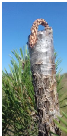
Clone 6010 orange