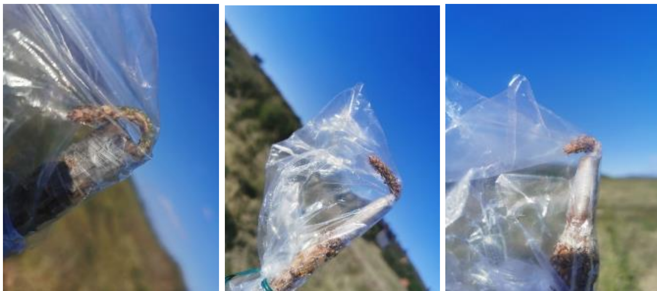
Photo 4 : Sur Pin laricio : Greffons secs. Poches plastiques souples, collées aux greffons dans le sens du vent dominant.