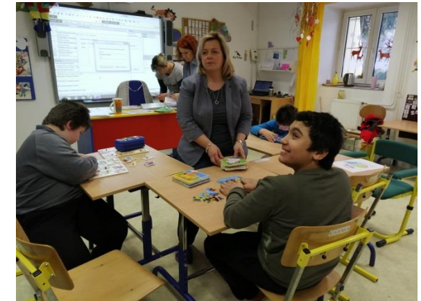
Obrázok 1 Výučba žiakov

★ Realizáciou aktivít projektu bude dochádzať k prehĺbeniu doterajšej spolupráce medzi partnermi. Zvýši sa pripravenosť žiakov na ďalšie vzdelávanie. Zavedenie nových učebných postupov a metód sa bude aplikovať po ukončení realizácie projektu v dobe udržateľnosti.