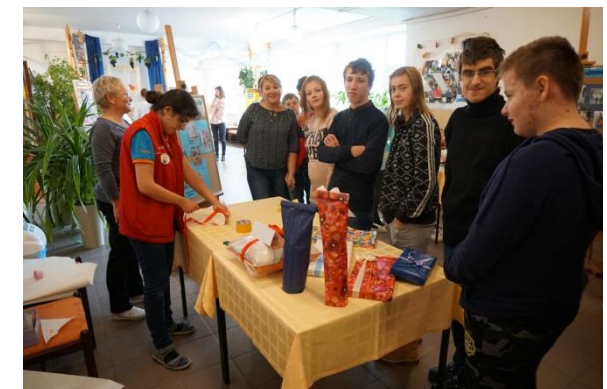
Obrázok 2 Aktivity žiakov