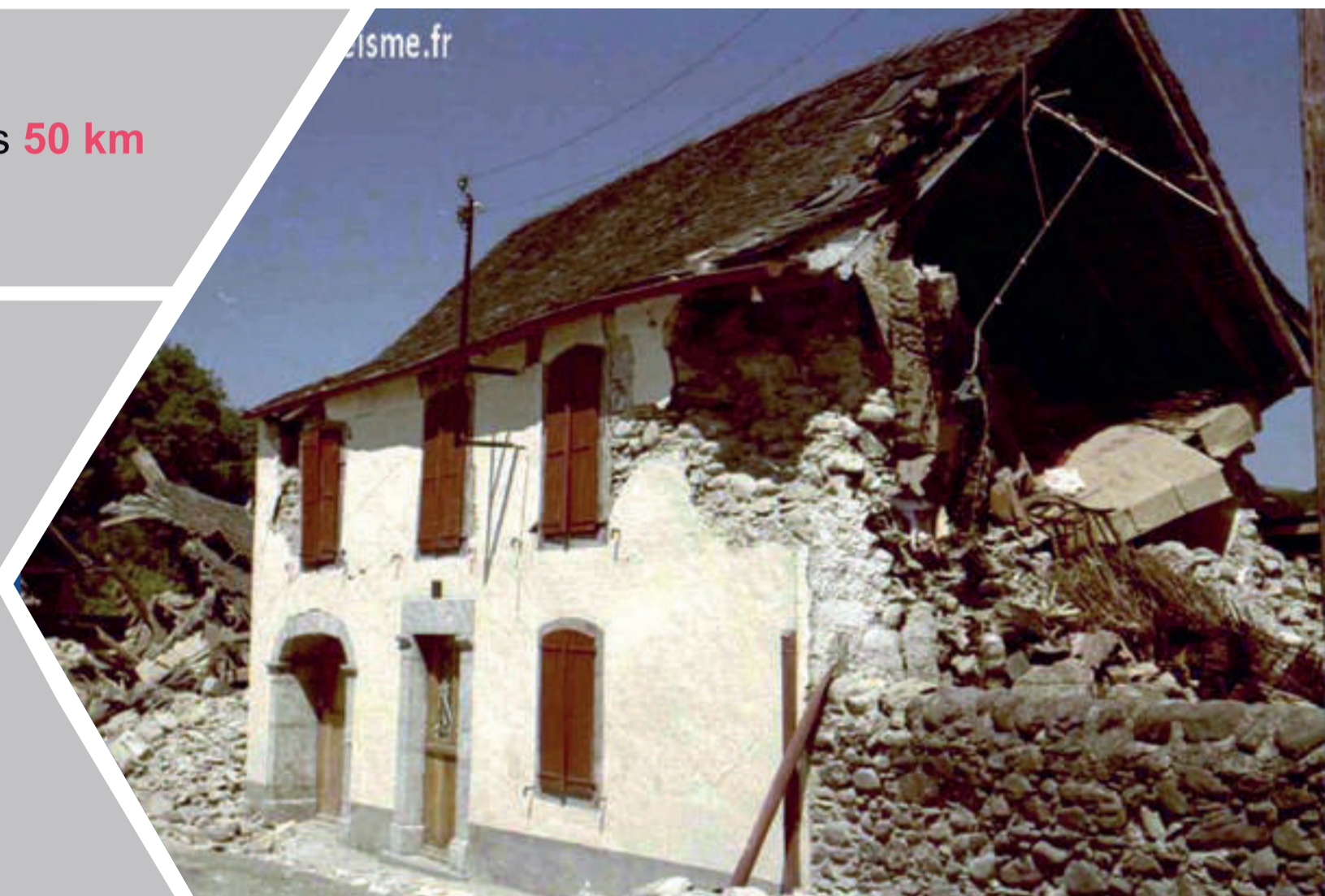
Terremoto de Arette en 1967

Cada año se registran unos mil terremotos en los Pirineos. La gran mayoría de ellos se encuentran en una franja de unos 50 km alrededor de la frontera franco-española. Surge una pregunta : ¿están los territorios de los Pirineos preparados para la ocurrencia de un gran terremoto y la gestión de una gran crisis? El proyecto evalúa las necesidades territoriales y tiene como objetivo proporcionar a los gestores de riesgos herramientas operativas y de toma de decisiones para garantizar una gestión óptima de las crisis futuras.