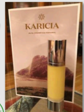
Figura 4.- Primera formulación cosmética del consorcio internacional SPAGYRIA.