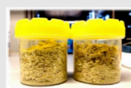
Figura 1.- Extracto supercrítico de Salvia sclarea (arriba), ciclón de la Planta de extracción y extracto de Calendula officinalis (dcha.).