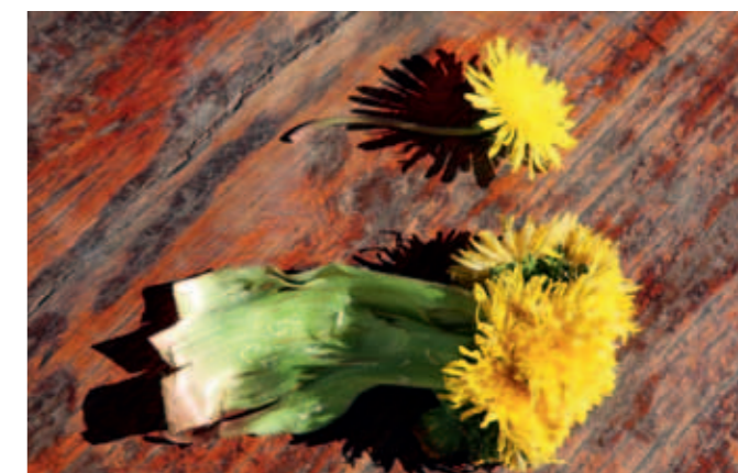
Regratova družina iz Slivja ... neimenovane najditeljice. Našteli so 11 cvetov iz skupnega debla.