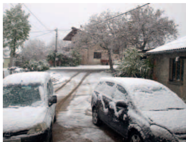
ZIMSKA IDILA APRILA NA MRŠAH...