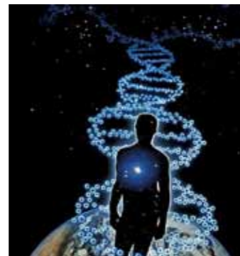
Naša DNK vpliva na informacijsko polje okoli nas

na. Nekateri od teh »pogrešanih« dokumentov so kumranski rokopisi (ali mrtvomorski zvitki), ki so bili celo predstavljeni splošni javnosti leta 2011. Veliko teh in podobnih dokumentov naj bi opisovalo odnos med človekom in stvarstvom ter moč človeških misli in čustev.