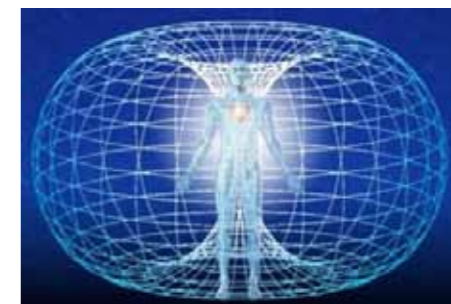
Elektromagnetno polje srca – cevasti torus