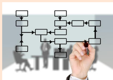
Autre partenaire de la démarche VAE