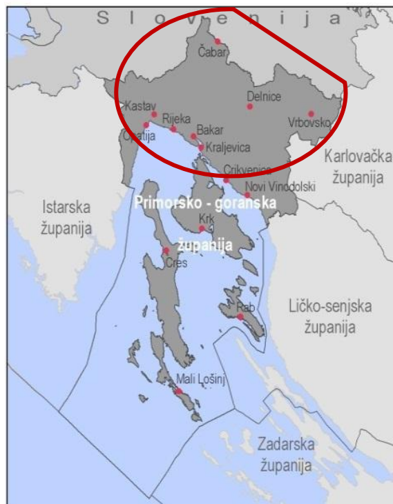
Slika 2. Primorsko-goranska županija in Gorski kotar

Subregijo gorje predstavlja Gorski kotar, ki ima površino 1.273 km 2 , na kateri živi 30.711 prebivalcev in je znan kot »Zeleno srce Hrvaške«. Bogastvo naravne dediščine Gorskega kotarja tvorijo Nacionalni park Risnjak, strogi rezervat Bijela in Samarske stijene , pomembni pejsaži » Vražji prolaz « oz. Hudičev prehod – Zeleni vir in Kamačnik , parki gozdov Japleniški vrh in Golubinjak , spomenik parkovne arhitekture Perivoj ob gradu v Severinu na Kolpi, reke in jezera, jame, mnogoštevilne rastlinske in živalske vrste.